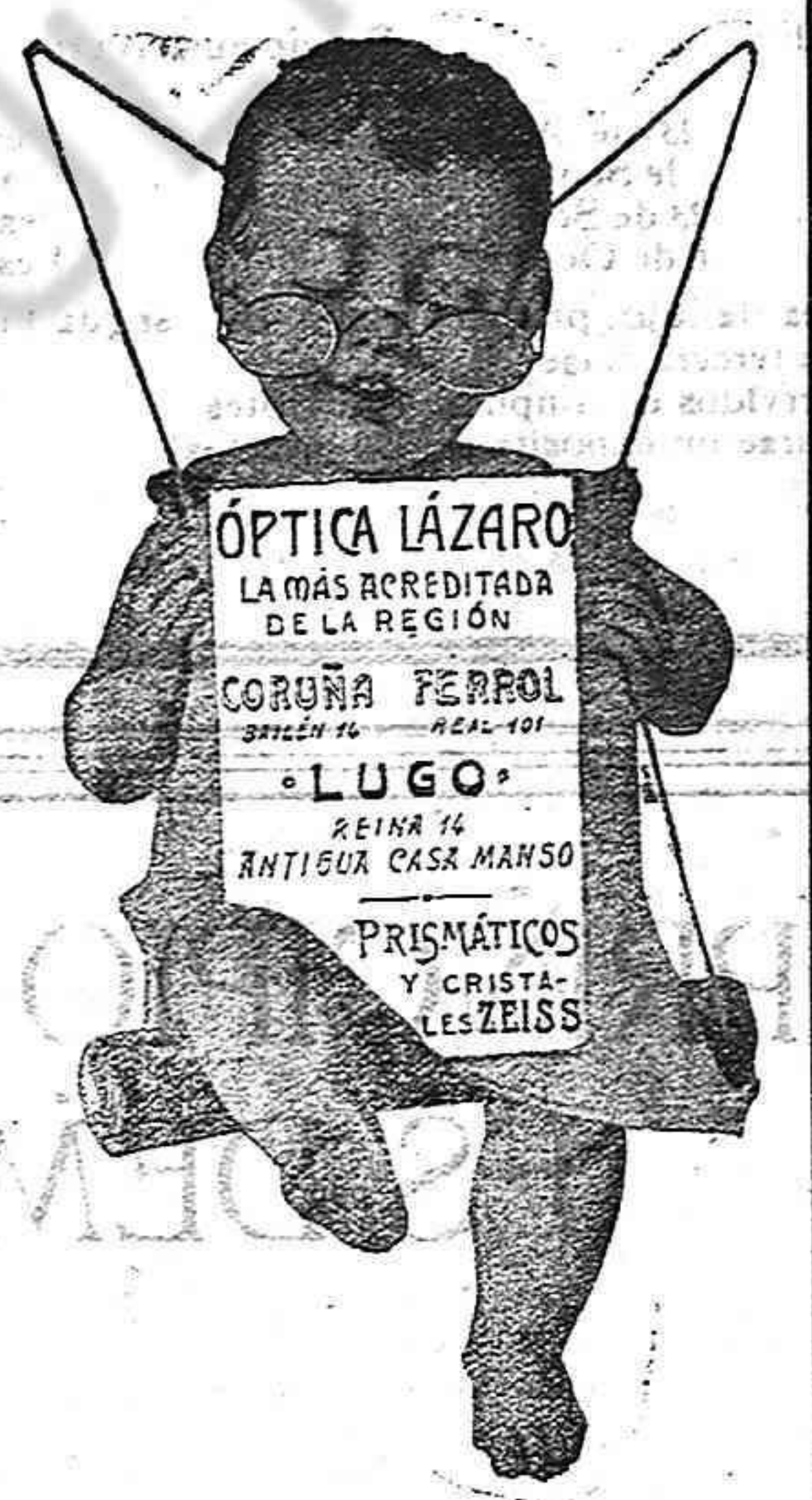
Colección de cristales esféricos, esféricos y maquinaria apropiada para la ejecución inmediata de recetas de los señores oculistas.

Tiene V. las últimas creaciones para la temporada en Casa Balbás Plaza Mayor 25 LUGO