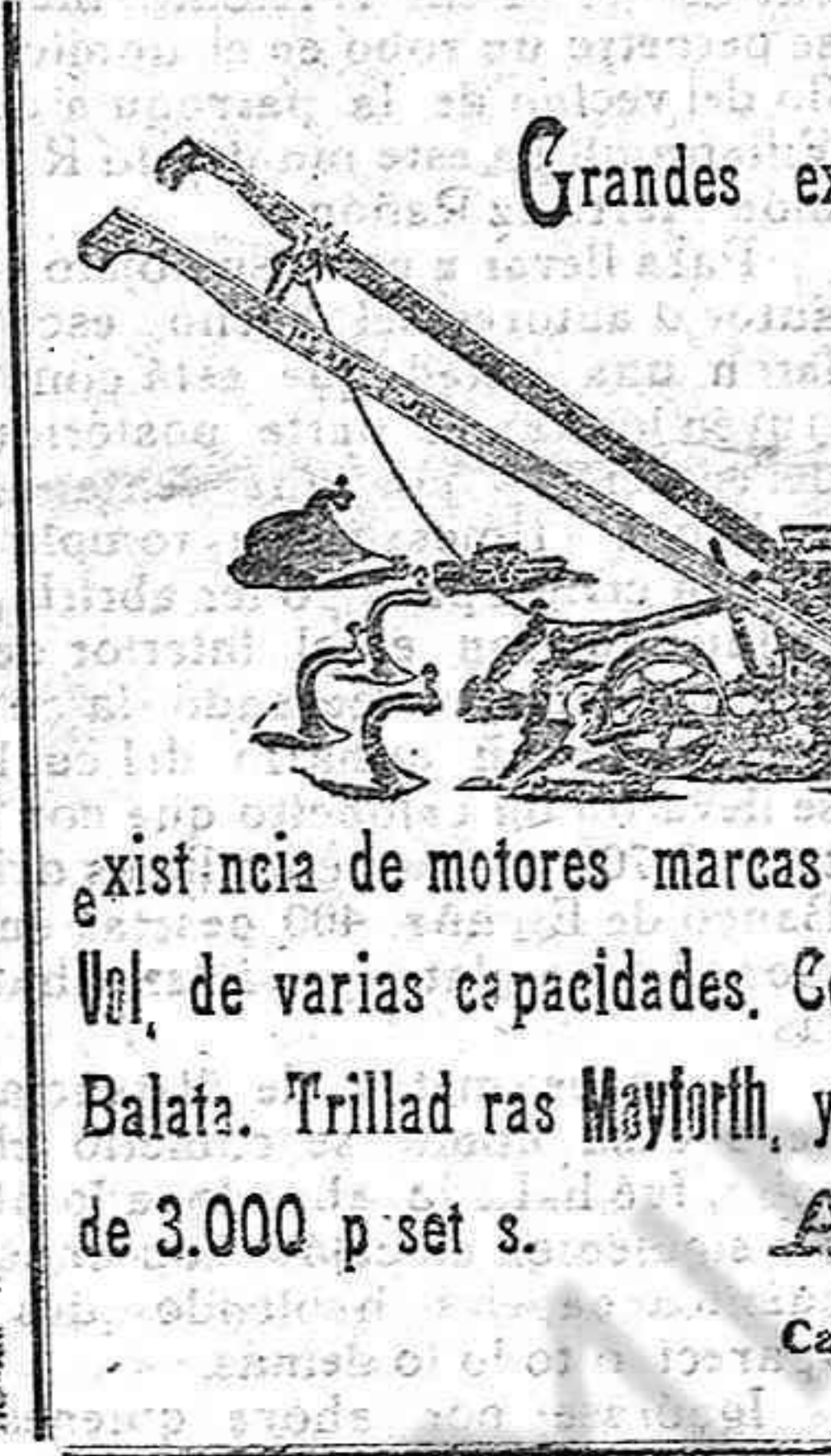
Grandes existencias en maquinaria Agrícola de todas clase y tamaños. Moto-Bombas, Electro-Bombas y Basculas para pesar ganado.