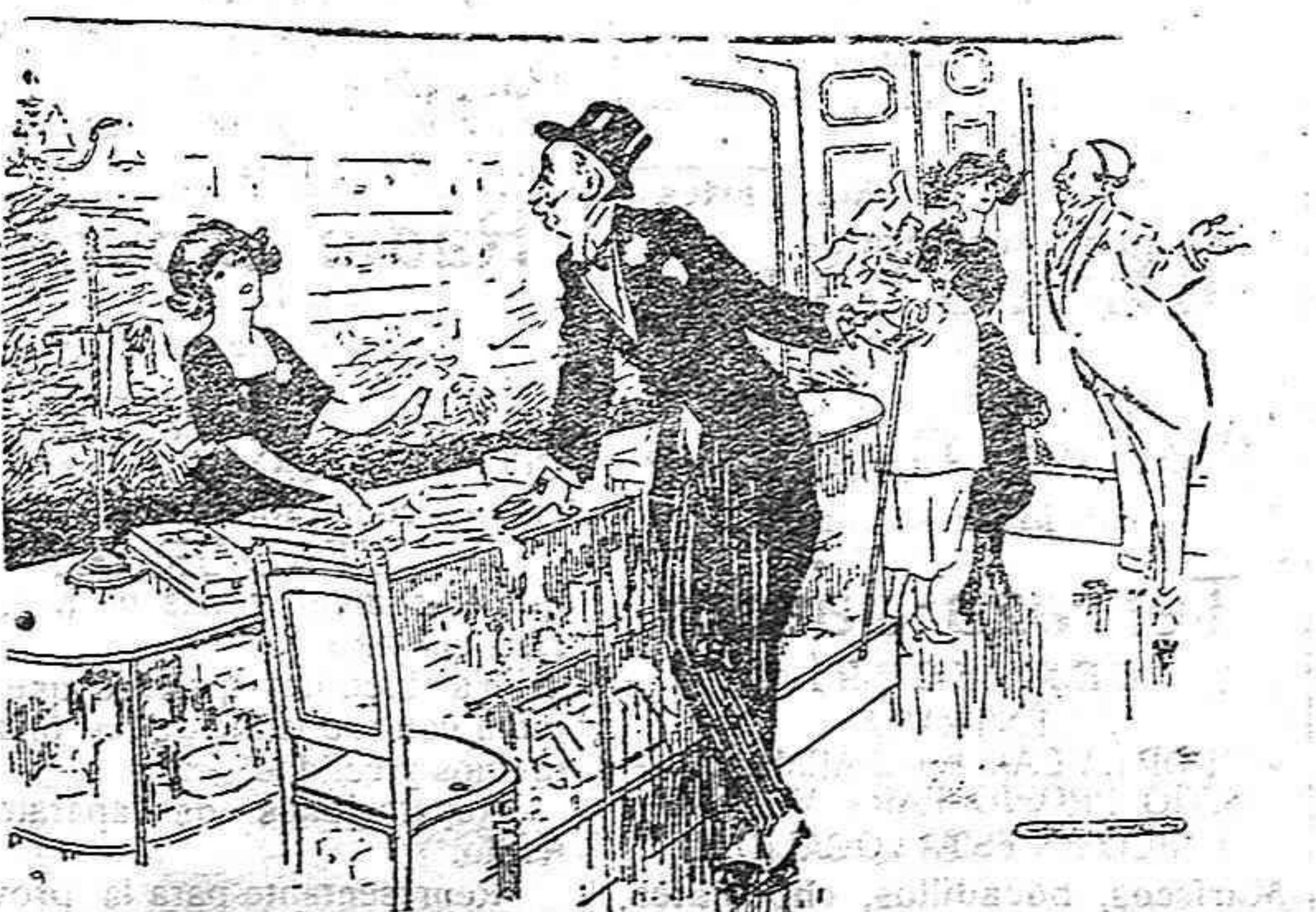
—De qué color quiere Vd. los guantes? —Lo mismo dá. De todas formas, mi mujer ha de decidirse por los que yo no lleve.

Ve a V. en 4.ª plana el anuncio de la AGENCIA REIJA