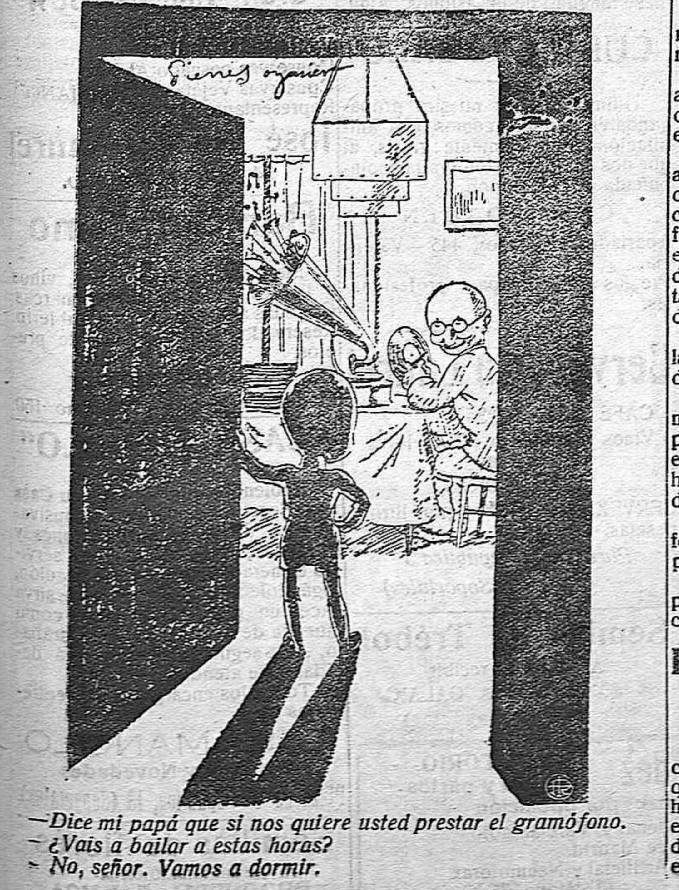
Dice mi papá que si nos quiere usted prestar el gramófono. ¿Vaís a bailar a estas horas? No, señor. Vamos a dormir.