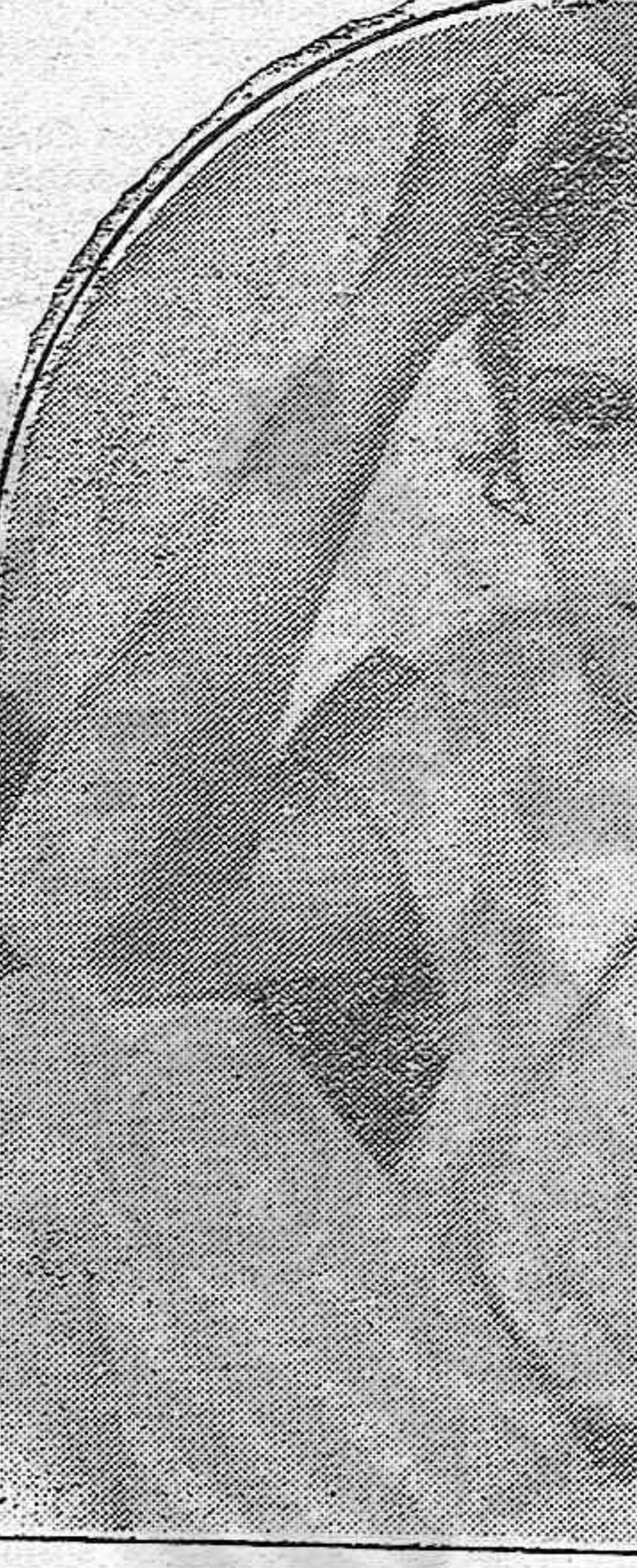
Genial protagonista del film «El último varón sobre la tierra», película que ha alcanzado un resonante éxito en la actual temporada cinematográfica.