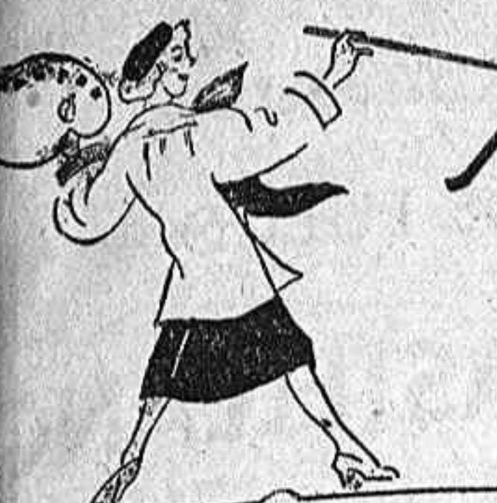
La belleza y el baño

Con solo hojear las páginas de la historia, podemos descubrir uno de los secretos más antiguos e importantes a la belleza y a la vida femenina. Las vivas imágenes de las hechiceras sirenas de la historia, aquellas que cambiaban a su antojo los destinos de pueblos y naciones, son modelos de los beneficios derivados del baño de belleza.