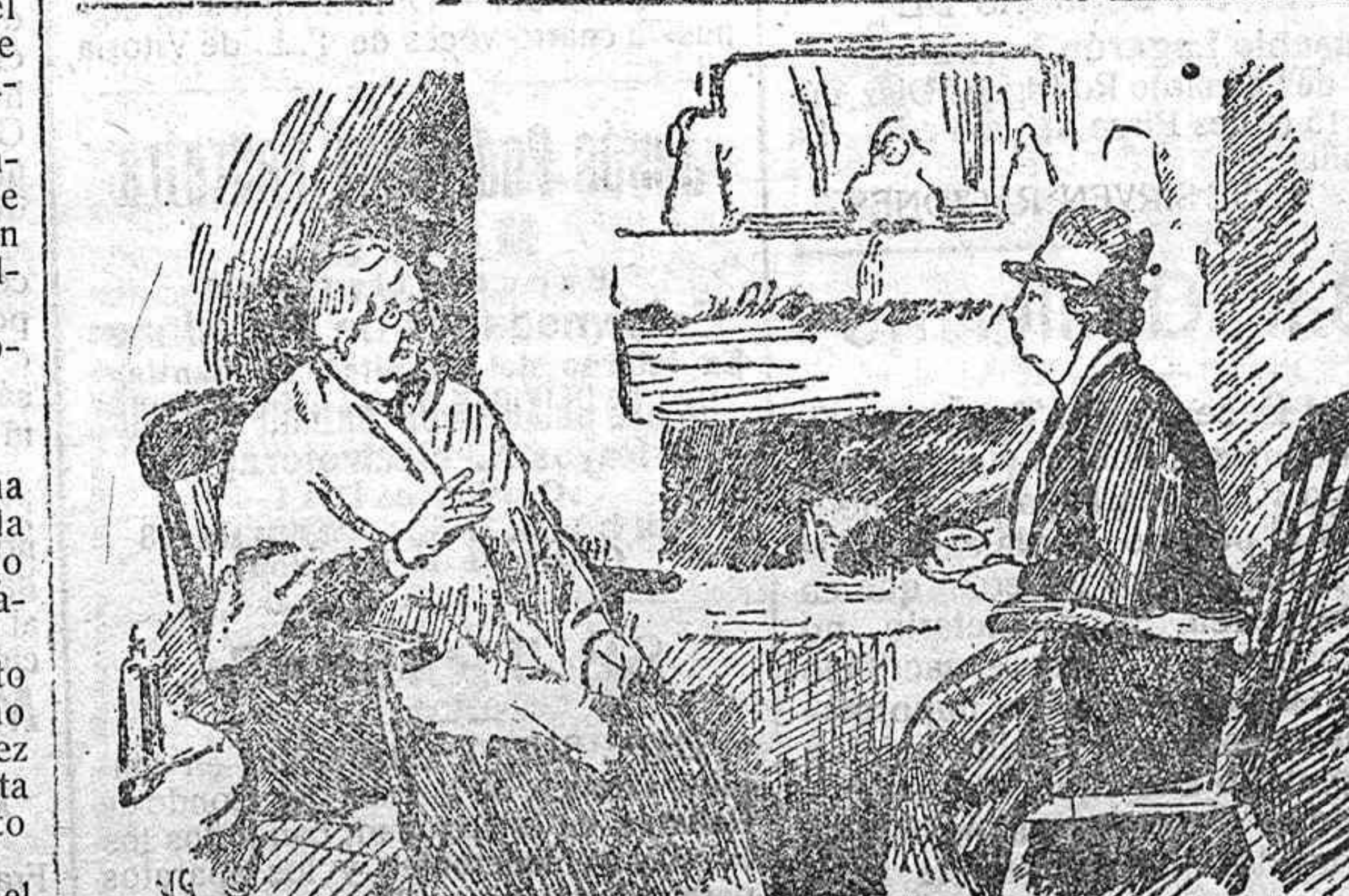
—Voy a cambiar de médico. Es muy distraído. Siempre que me toma el pulso se pone a mirar el reloj.

Una Cámara única con un tercio de candidatos y del sufragio Universal un tercio elegido por las Corporaciones y