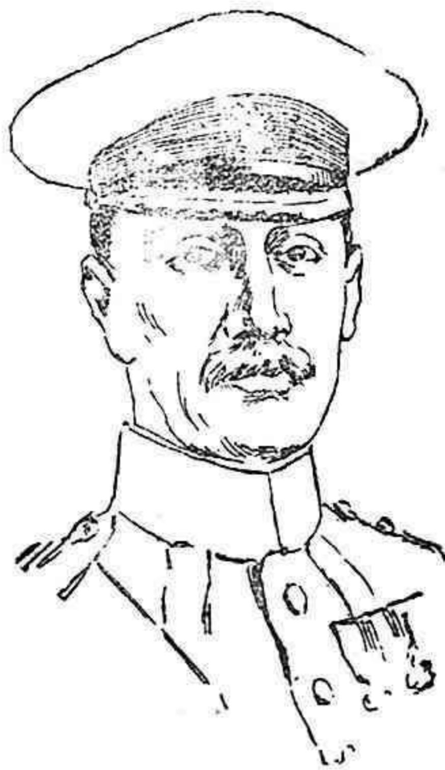
Mayor general Inguille-Williams, comandante del ejército británico que opera en el sector del Ancre.