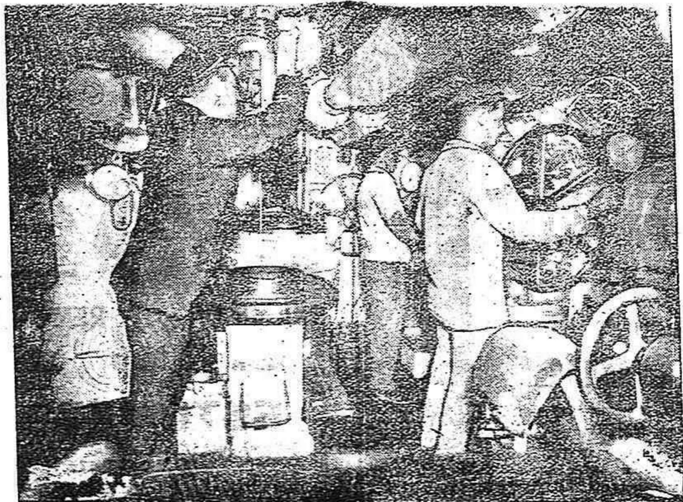
Interior de un submarino francés