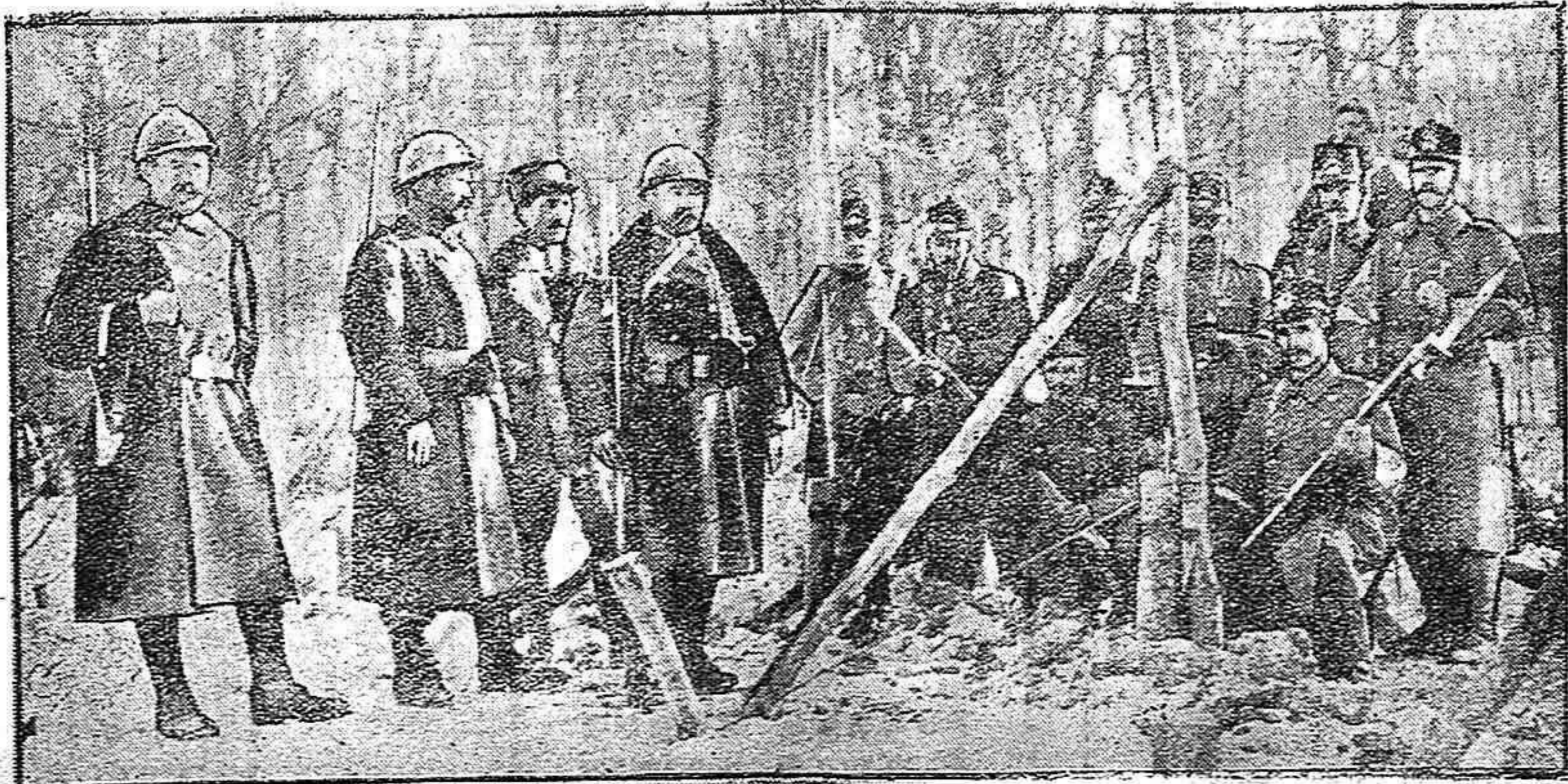
Soldados franceses y rusos fraternizando en la frontera