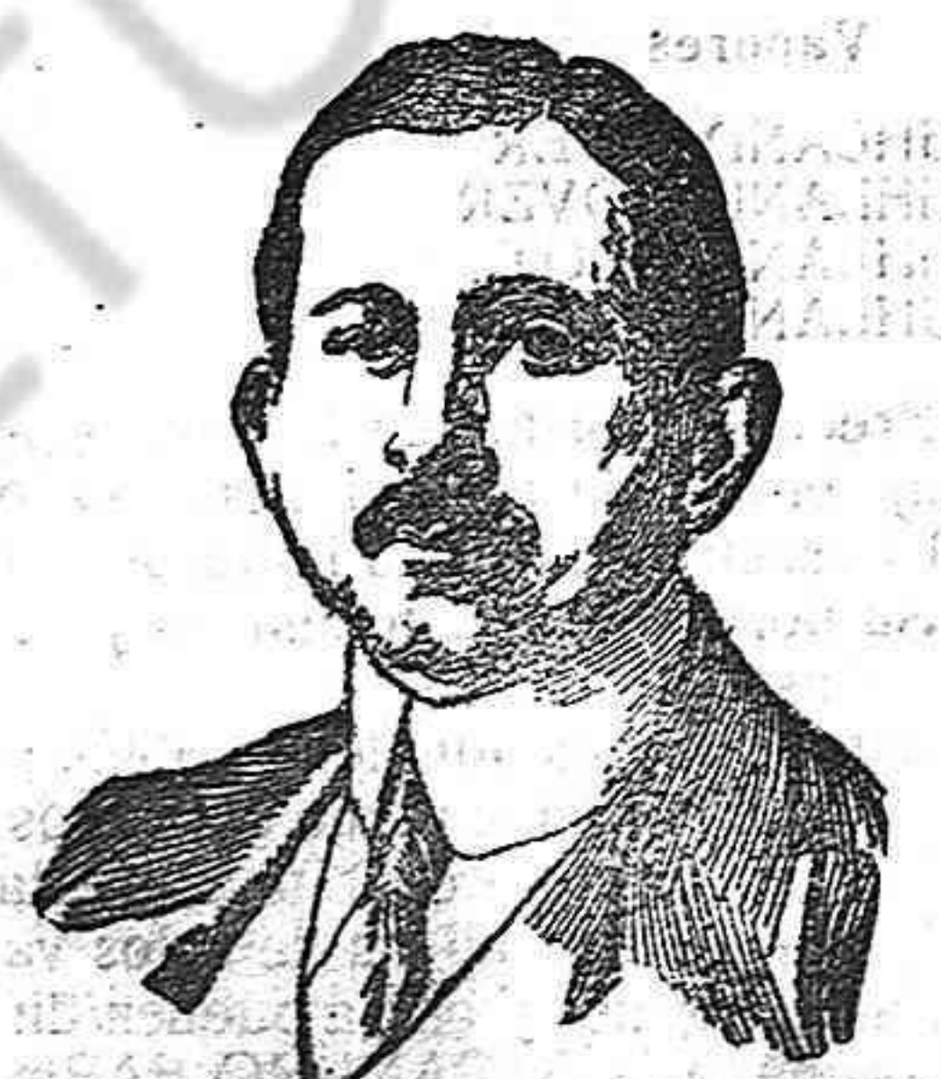
Príncipe Burhan Eddine

Muerto el príncipe Iusuj Izzedin, acerca de cuyo fin circulan las más contrarias versiones, queda vacante el alto puesto de heredero del trono de Turquía, y como es preciso cubrir esta vacante en el más breve plazo y la prevención es muy apetecible, se intriga y cabaldea arduamente en las altas esferas de la política otomana.