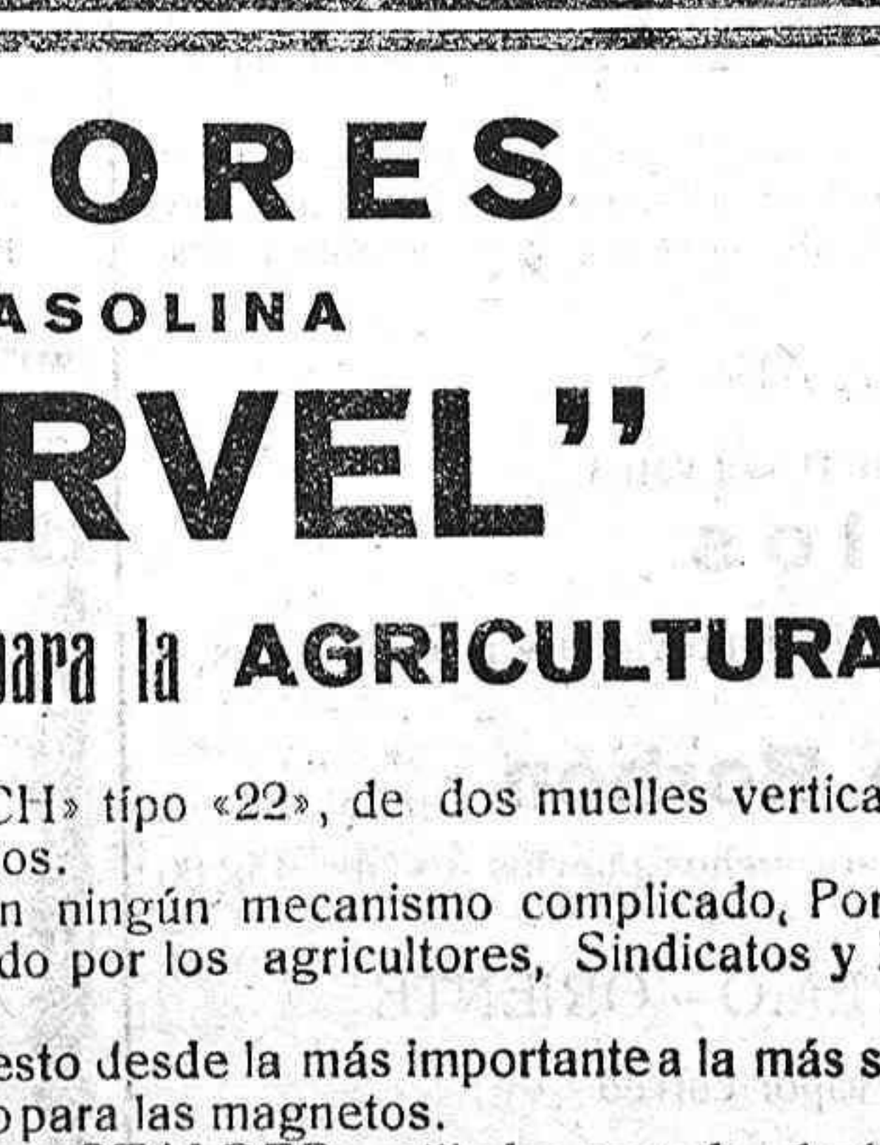
Fuerza 5 y 7 HP. Efectivos