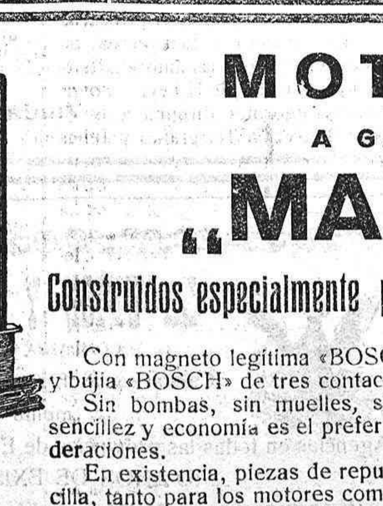
Fuerza 5 y 7 HP. Efectivos