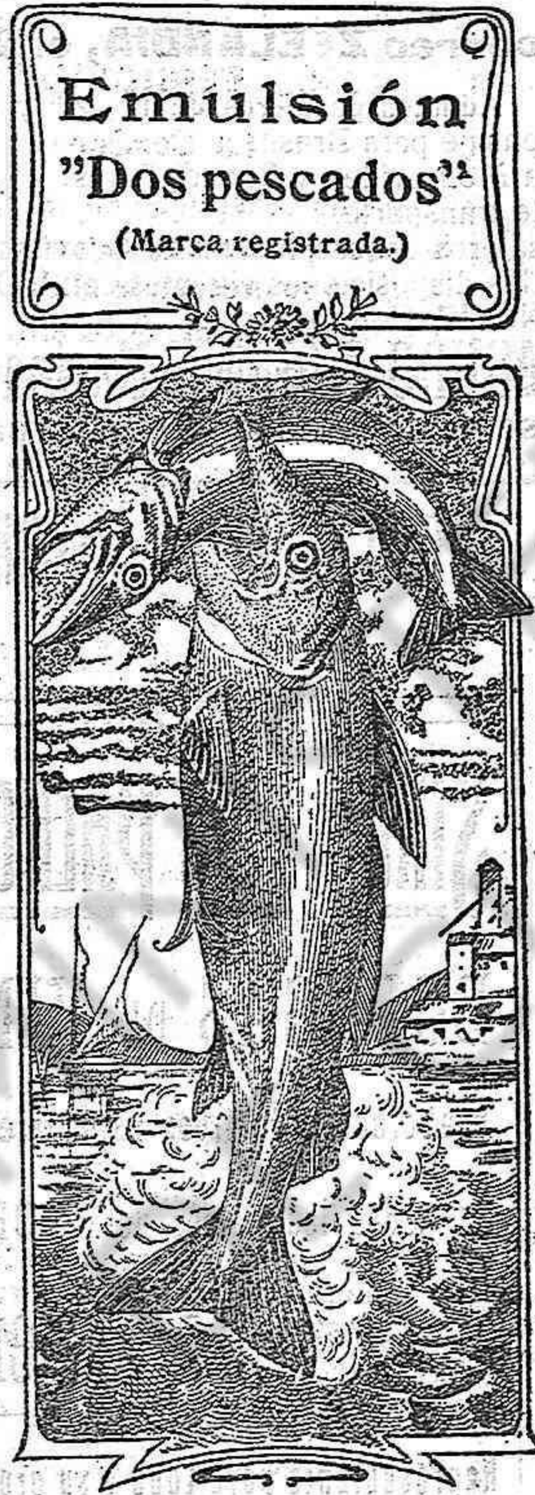
Emulsión "Dos pescados" (Marca registrada.)

cho dueño en Sarria, procurador, calle Mayor, 19.