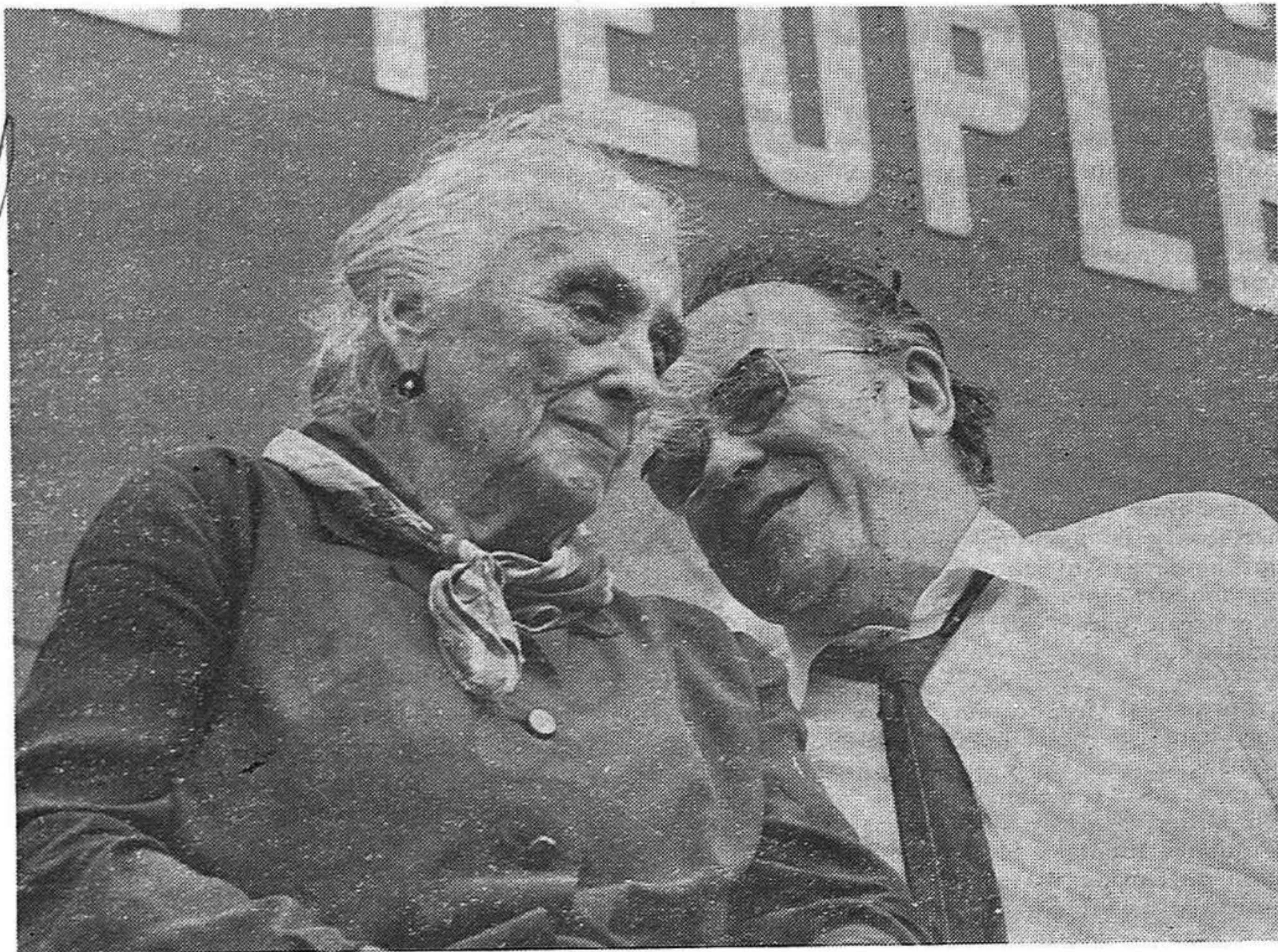
Dolores Ibárruri y Santiago Carrillo en un momento del mitin

Segura de interpretar, no sólo vuestros sentimientos, sino los sentimientos de todos los que se enfrentan en España contra la dictadura franquista, permitidme expresar al Partido Comunista Francés y a todos los que de una u otra manera han hecho posible la celebración de este acto, nuestro más profundo agradecimiento.