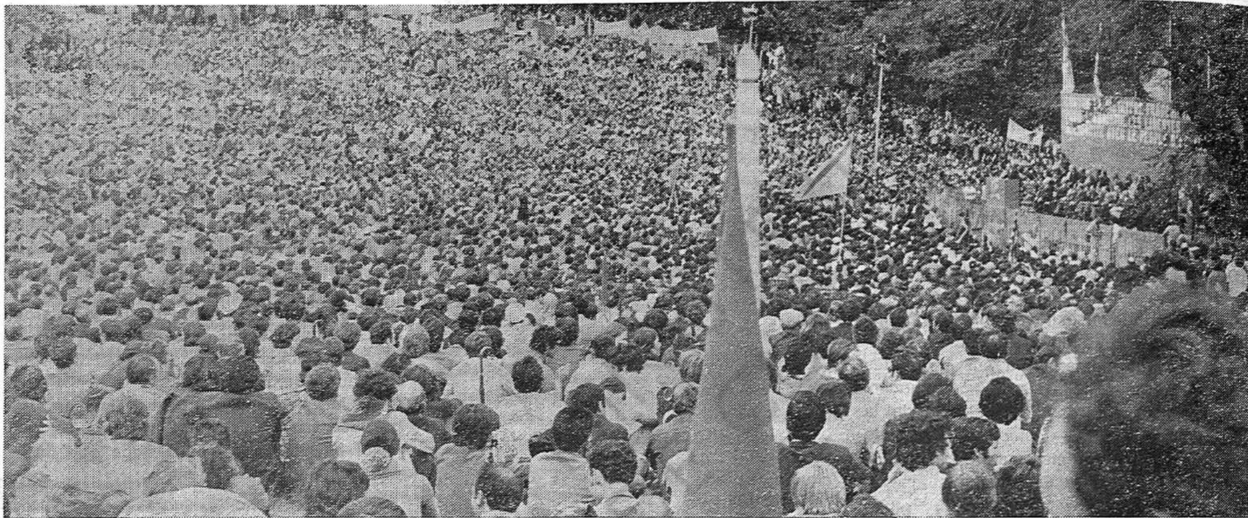
Un magnífico aspecto de la multitud congregada en el mitin del Parque Montreau, en torno a Dolores, a Santiago, al Partido Comunista de España

LLAMA «a todos los trabajadores, a todos los demócratas, hombres y mujeres, jóvenes y adultos, a intensificar, en la más amplia unión, su solidaridad con el pueblo español».