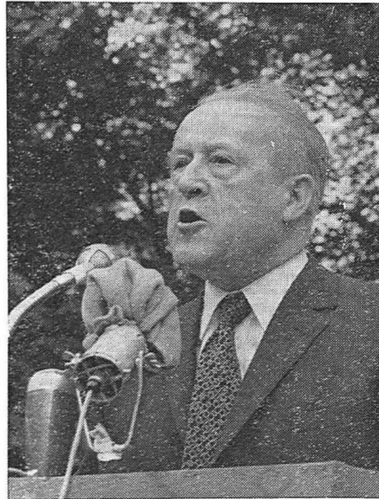
Con el discurso del camarada Fajon comienza el acto

«Así, la semana de solidaridad adquiere todo su peso de solidaridad internacional. Organizándola, los comunistas franceses son fieles a las tradiciones de su Partido y a los compromisos que suscribieron, de concierto