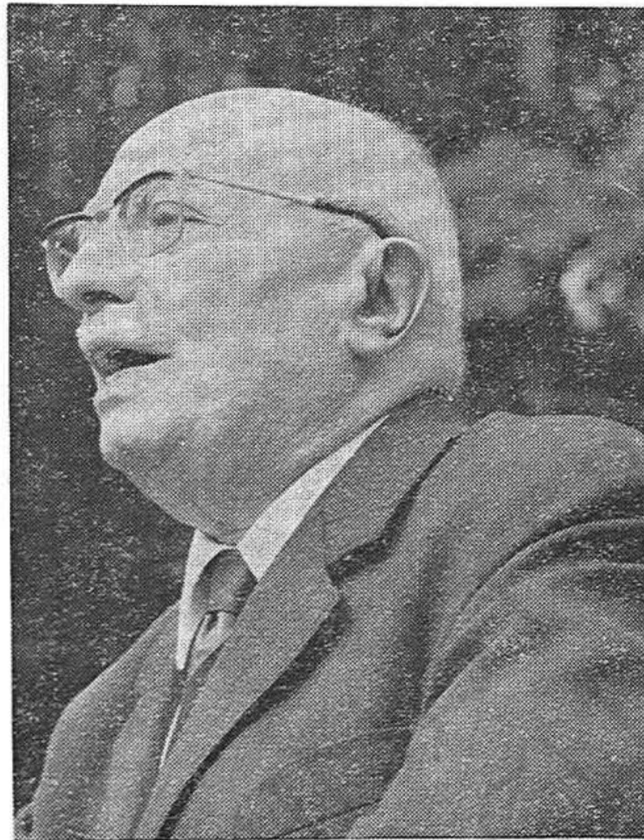
Jacques Duclos durante su discurso

«No se trata de renovar el gesto de Poncio Pilatos lavándose las manos; se trata de