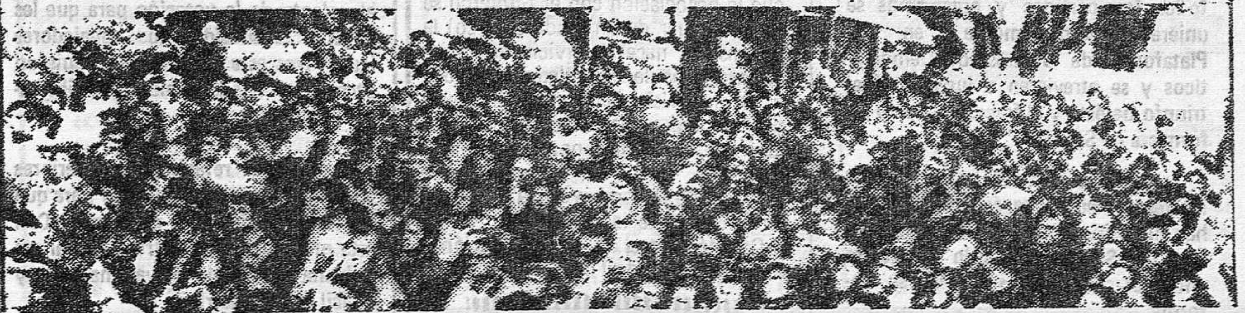
"Los obreros de la construcción de Navarra han demostrado que hoy organizarse para la lucha, significa levantar su propio Sindicato Unitario".

En la asamblea donde decidieron sacar su lucha a la calle y buscar la solidaridad del pueblo, los trabajadores de la construcción de Navarra discutieron sobre la situación política del país, comentando la maniobra antidemocrática que el Gobierno Suárez está llevando adelante con su "Reforma política" y aprobaron un manifiesto en el que anuncian su posición de boicot a la farsa del referéndum y promover entre el pueblo la ABSTENCION.