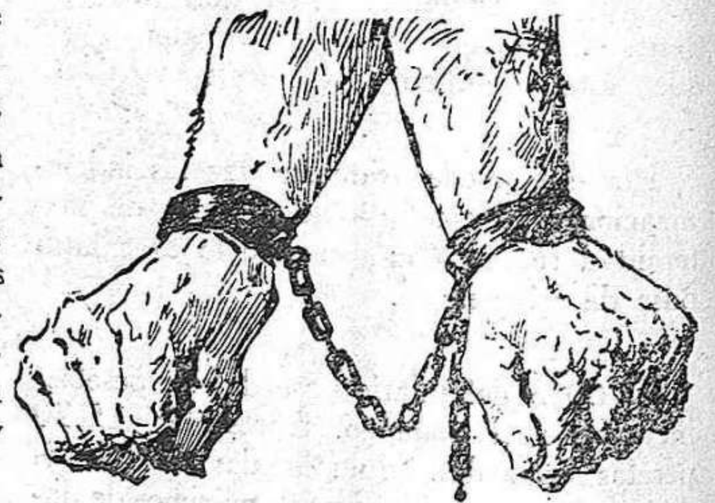
¡Rompe estas cadenas!

Hermanas: a vosotras también hacemos llegar nuestra promesa firme de poner to-