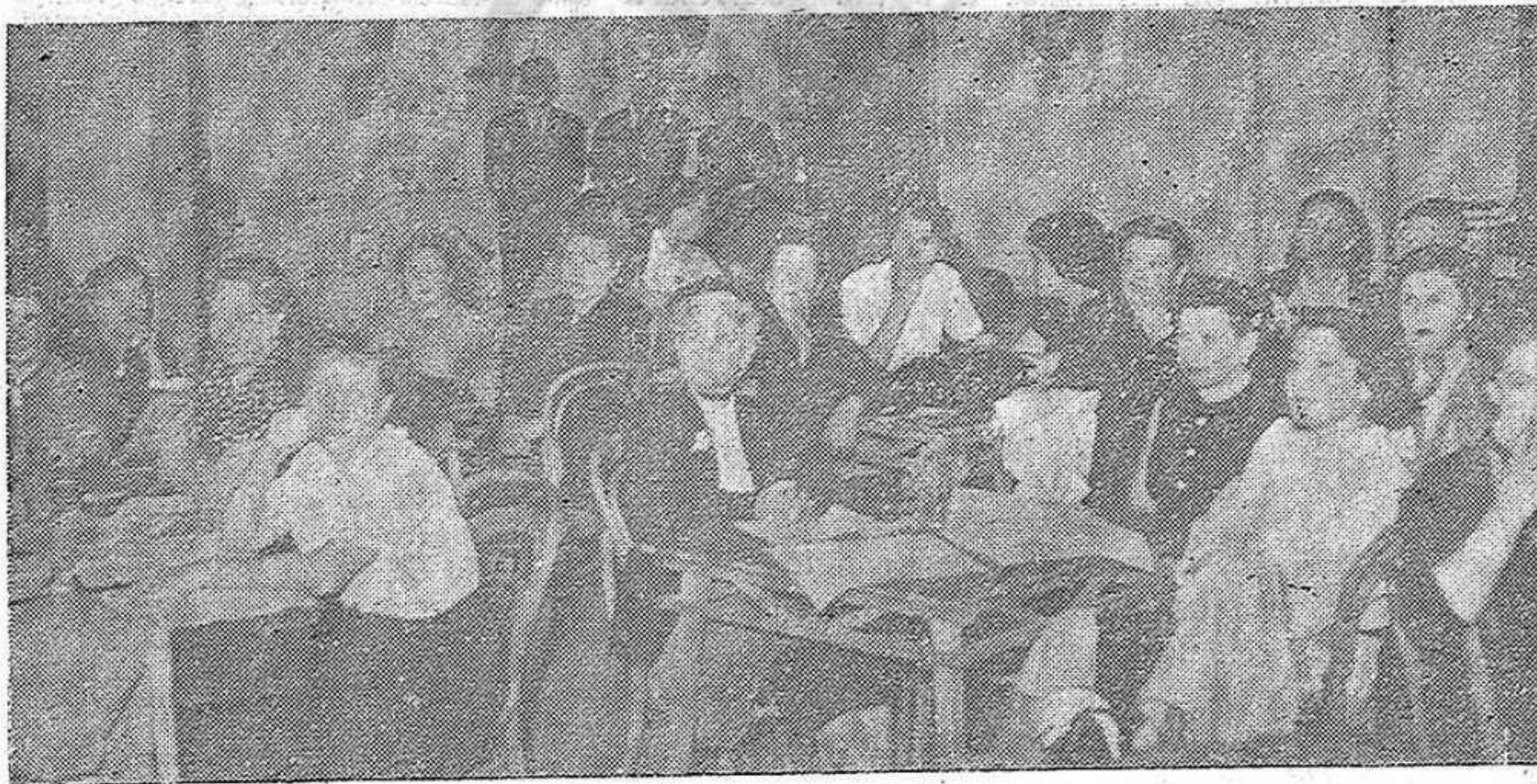
Un aspecto de la sala en el acto del ocho de marzo.