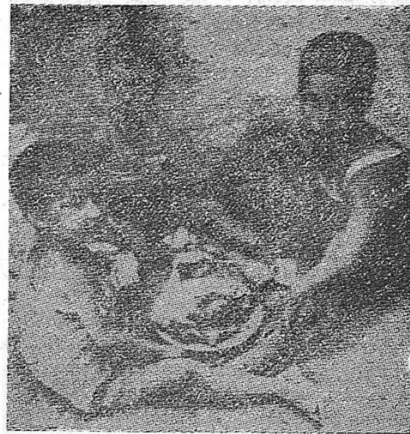
Niños esqueléticos, sin pan, sin abrigo: esta es la vida de la infancia bajo el franquismo.