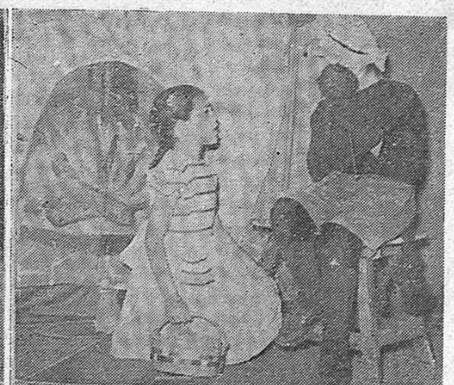
Escenas de "La Caperucita Roja" interpretada por un simpático grupo de niños.