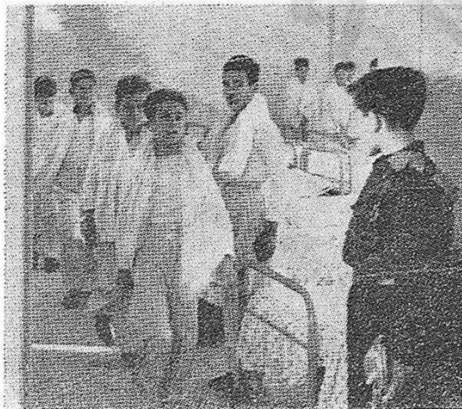
Lugares de reclusión para los niños, en vez de sanatorios.

Estos hechos brutales serán denunciados ante el mundo en la Conferencia Internacional de la Infancia que se celebrará en Viena, del 12 al 16 de abril. La defensa de la infancia española es un deber ineludible de todo hombre o mujer de nuestro país, con sentimientos humanitarios, es también una parte de la lucha por la paz y contra el régimen generador de tanta desventura para nuestros niños. Como una parte preparatoria de la Conferencia de Viena, se acaba de celebrar en México la Conferencia de los Españoles de México en Defensa de la Infancia. La U. M. E. de México llama, con la seguridad de que su llamado encontrará una acogida calurosa en el sensible corazón de todas las mujeres españolas a que éstas presten todo su calor, su simpatía, sus esfuerzos y apoyo a la Conferencia Internacional en Defensa de la Infancia así como a todas las actividades que se desprenden de las resoluciones de la Conferencia de los españoles en México.