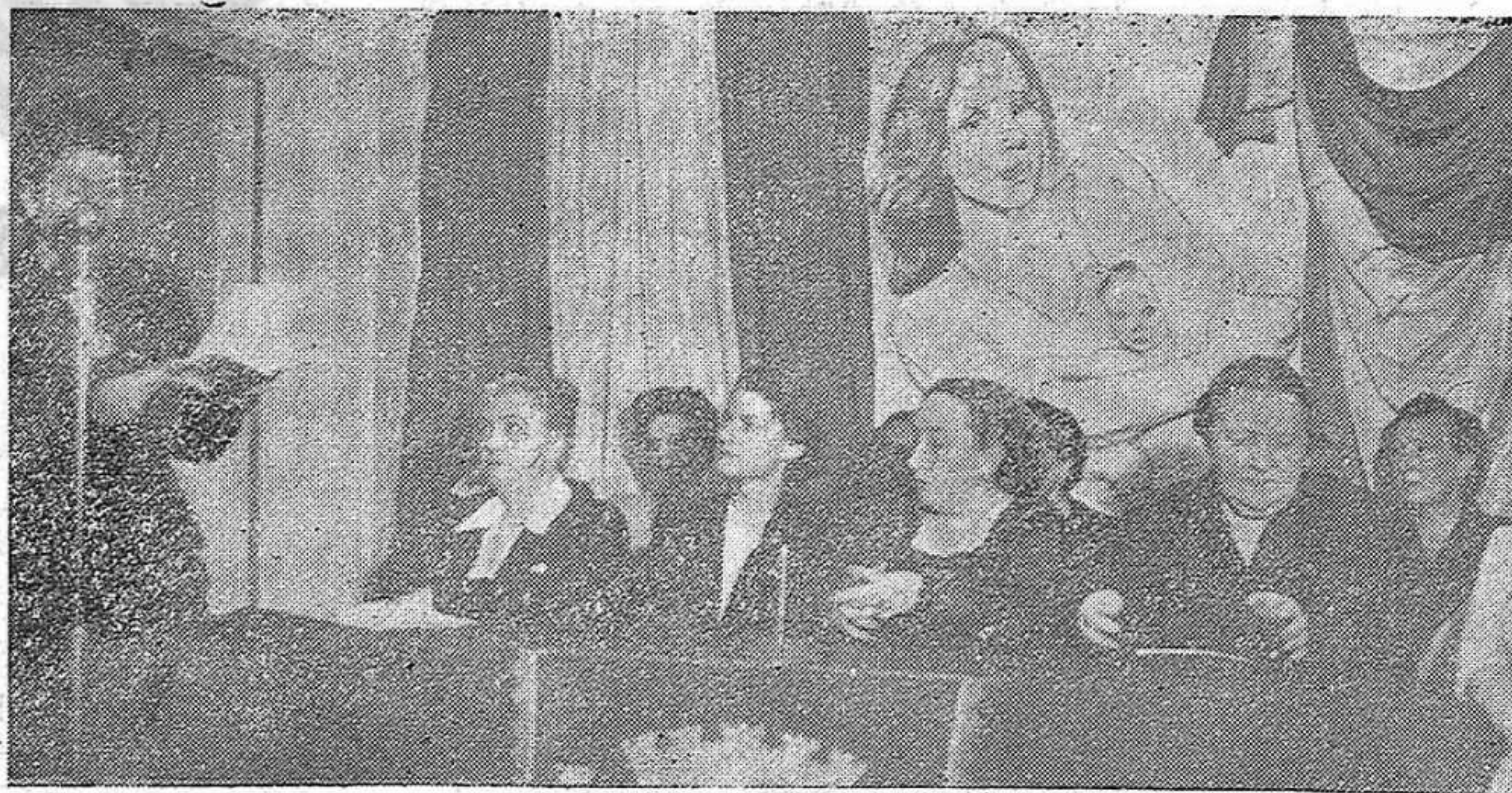
Presidencia del acto celebrado el día 8 de marzo.

En este ocho de marzo estamos con las mujeres soviéticas, de China y de las democracias populares, con nuestras heroicas mujeres que luchan en el interior de la patria, de corazón a corazón. Luchemos unidas, seguras de que el porvenir será de los pueblos, que contribuiremos a forjar un mundo de paz, donde la infancia sea feliz.