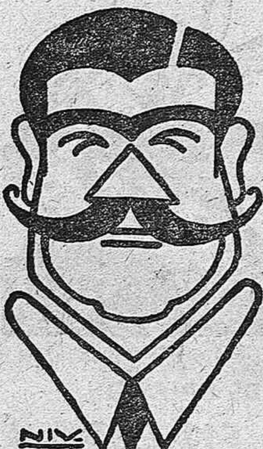
El general Berenguer, militar fracasado y político más fracasado aún

siestra, porque en sus manos ha estado durante muchos años no sólo la dirección política del país, comenzando por la propia Monarquía, sino la economía en general. Sus tentáculos llegaban hasta lo más recóndito de la vida financiera e industrial de nuestro país. Y por salvar sus intereses, era capaz de vender a su patria o a su familia al extranjero. Su salida de España, estando preso por los revolucionarios de San Sebastián, reclamado por una potencia extranjera, como pago a los servicios que le había prestado, y el saberse que ha pertenecido al "Intelligence Service", da una idea clara de lo que era capaz este personaje, que ha sido figura máxima durante medio siglo en la vida social-política y financiera de España. Para salvar sus intereses en las minas de hierro de Beni-bu-Frur, se desencadenó la terrible guerra de Marruecos, que costó a España miles de millones y millares de vidas en flor. Dueño absoluto del Banco Hipotecario, ejercía dentro de esta entidad un especial espionaje para apoderarse de las mejores fincas rústicas y urbanas de España. Así llegó a ser el mayor propietario de nuestro país y el terrateniente que pagaba mayor contribución por fincas rústicas. En rapacidad y en astucia poca gente aventajó a este siniestro hombre de negocios.