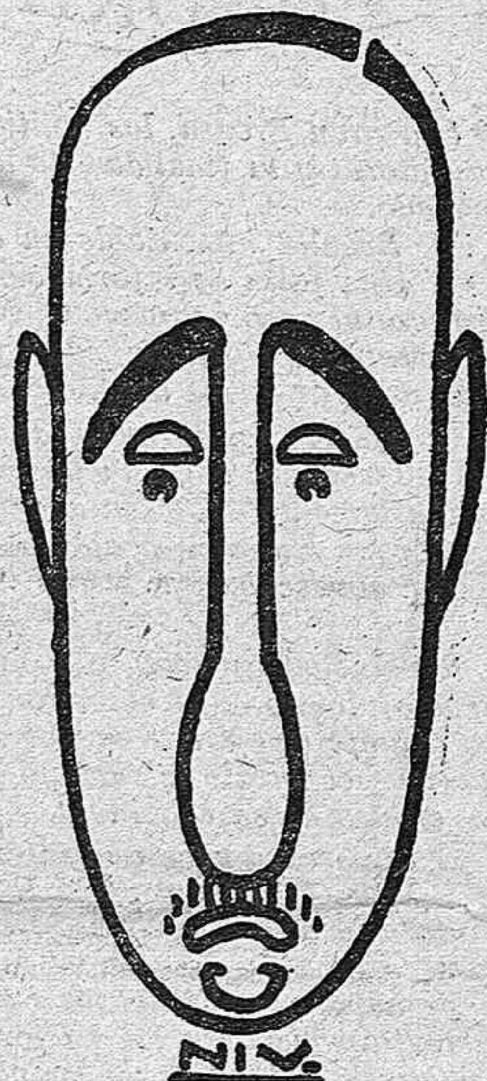
Ventosa y Calvet, testaferro de Cambó, perro faldero de la Monarquía... y de la República

Poco más de un año duró el período de transición entre la Dictadura y la República. En la caída del dictador intervino un factor, además de las causas ya expuestas, cuya actuación vale la pena dejar registrada en estos reportajes, como dato para la Historia de aquel período. Por entonces se habló mucho de Cambó, como coleccionista de obras de arte. Se le creía sólo un financiero de acusada mentalidad fenicia, pero al mismo tiempo que atesoraba millones, se las