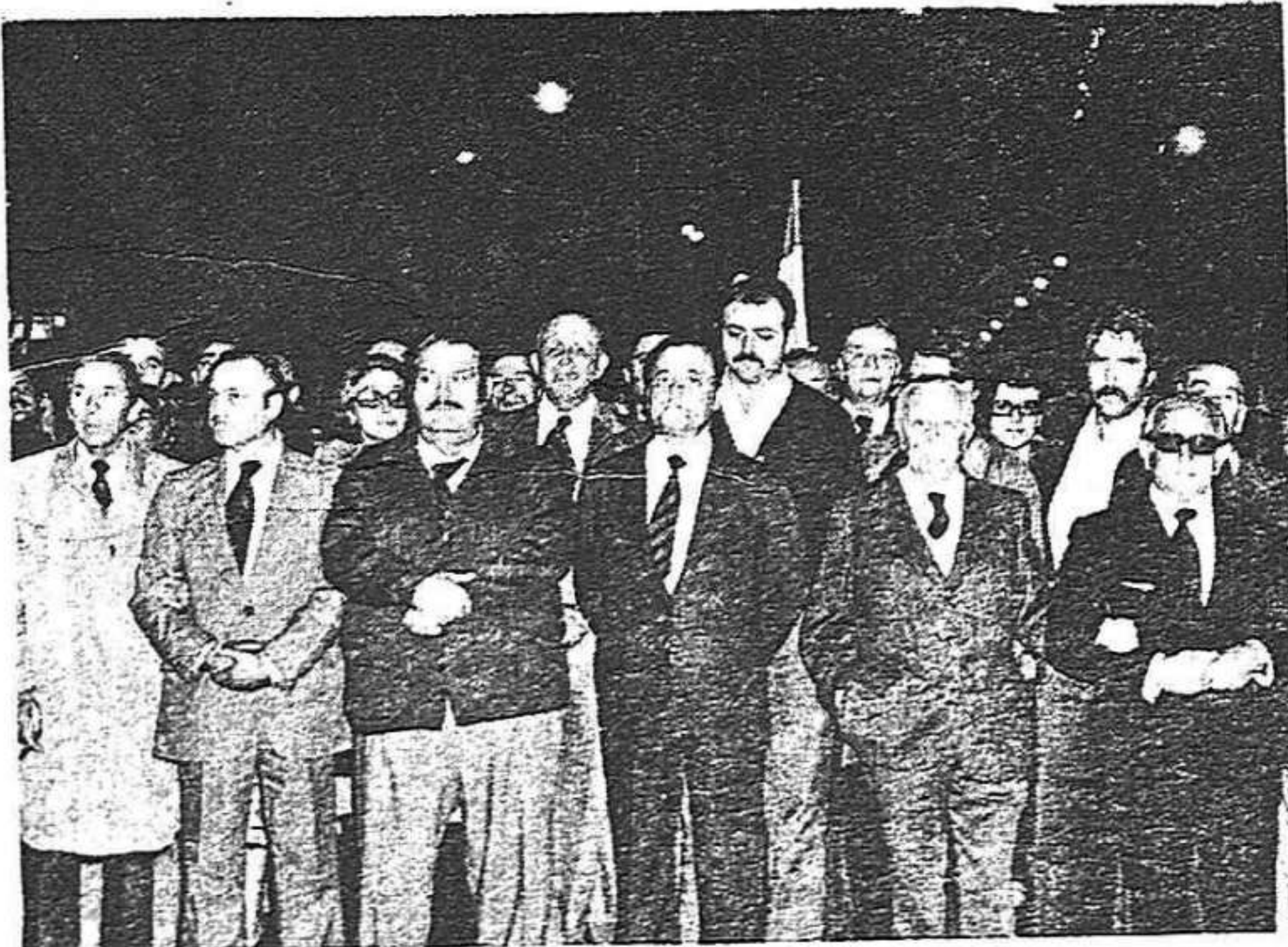
Los dirigentes fascistas campan a sus anchas. El peligro que encierran lo eliminaremos con la Constitución Democrática que acabe con todos los residuos franquistas.

El Gobierno no está interesado en acabar con ellos. Tenemos que conseguir que se elabore rápidamente la Constitución Democrática que quite cualquier vestigio de poder a los fascistas. Así haremos frente al peligro que entrañan.