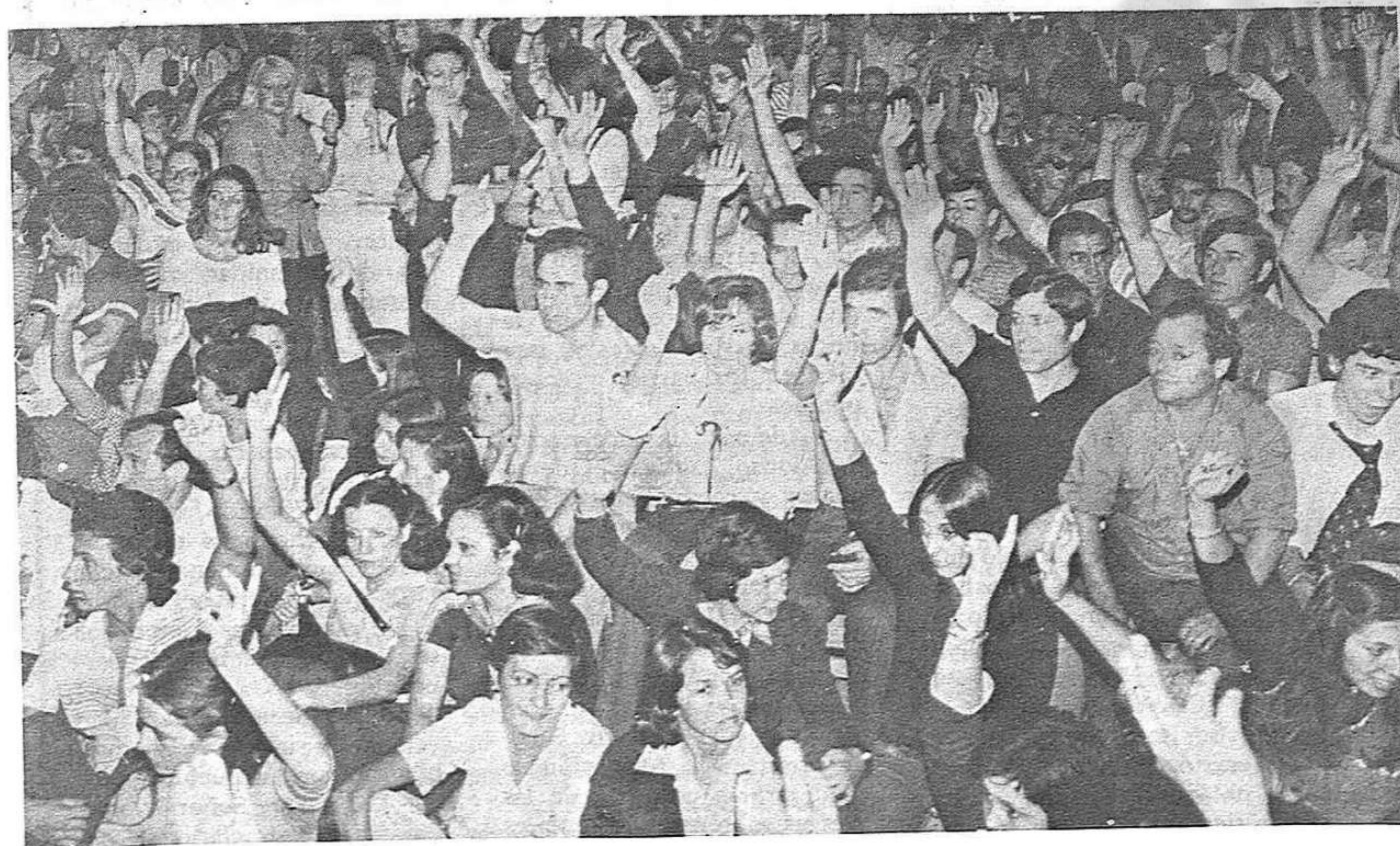
Comienza a expresarse el descontento de los trabajadores.

*500 trabajadores del Metal, reunidos en Asamblea en Miranda de Ebro, adoptaron una decisión en el mismo sentido. A propuesta del Sindicato Unitario fue ratificada por todas las centrales sindicales allí presentes.