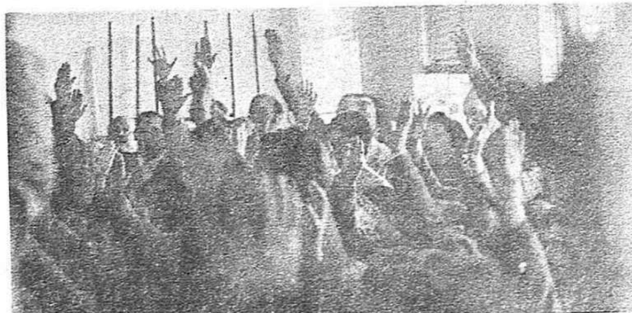
En las elecciones sindicales se fortalecerá, sin duda, el sindicalismo de clase. A pesar del Gobierno y de quienes le apoyan.

Los trabajadores, no podemos aceptar de ninguna manera este chantaje del Gobierno. Frente a él, hay que cimentar la exigencia de la convocatoria urgente de las Elecciones Sindicales y potenciar la denuncia del pacto en asambleas, mítines, etc.