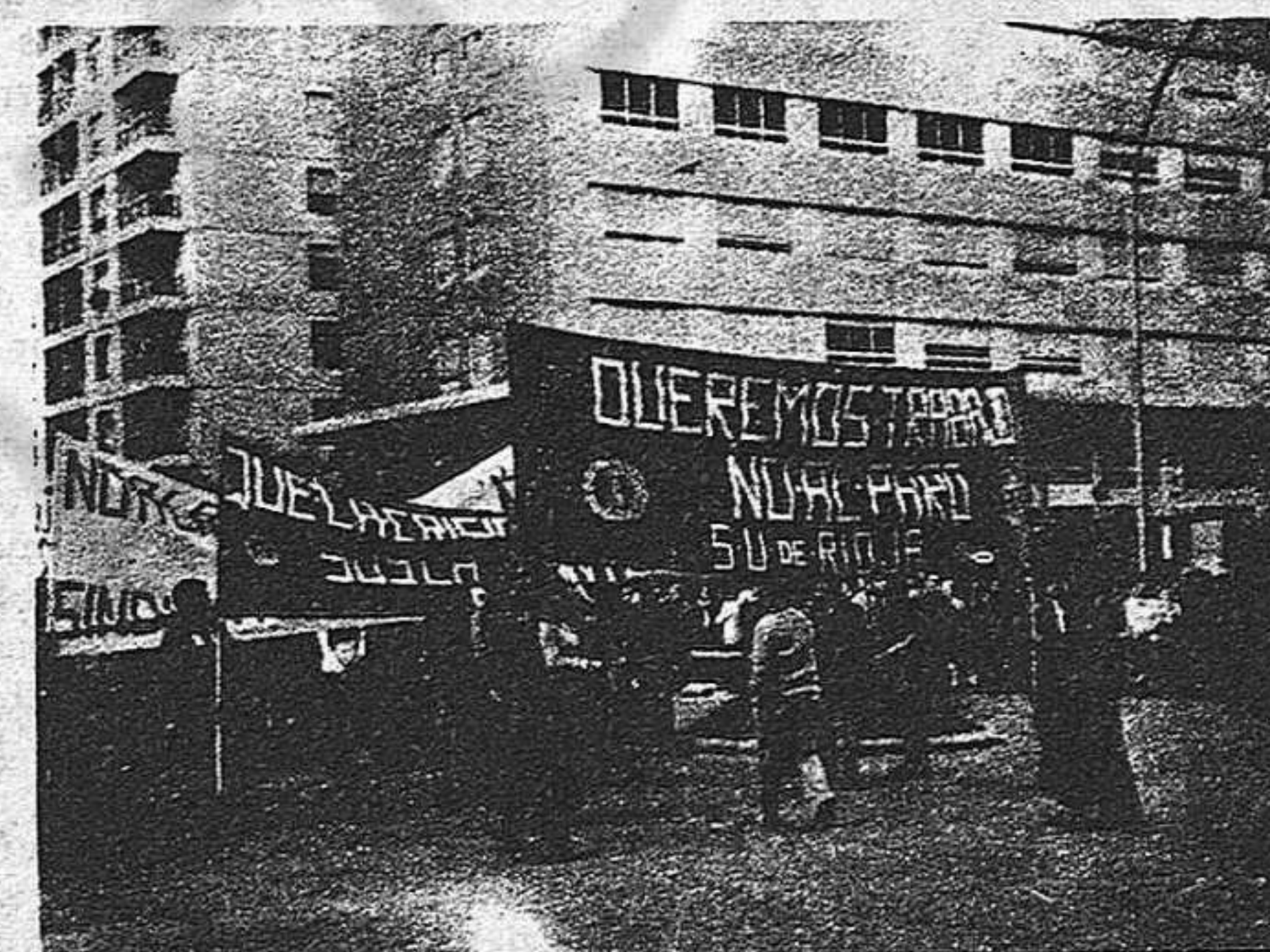
Tenemos que lograr una acción común que obligue al Gobierno a prestar la debida atención al paro.

El paro se agudiza día a día. La crisis económica al no haberse tomado medidas que traten de resolverla realmente se va haciendo más aguda, aumentando sus secuelas del paro y la inflación. El sector naval está en crisis; se habla de reestructuración, de falta de inversión... en definitiva, de despidos de trabajadores que afectarían, fundamentalmente, a la Bahía de Cádiz, Sevilla y la zona de El Ferrol. El sector textil, también está en crisis, trayendo la angustia a miles de trabajadores de Catalunya; lo mismo ocurre con la construcción, con con la ya vieja crisis del campo. Si a esto añadimos los numerosos expedientes de crisis de pequeñas y medianas empresas, a los que ya estaban en paro y siguen sin encontrar trabajo, el paro, entre la juventud y la mujer, nos encontramos con la verdadera dimensión de esa lacra social que es el paro en el Estado español.