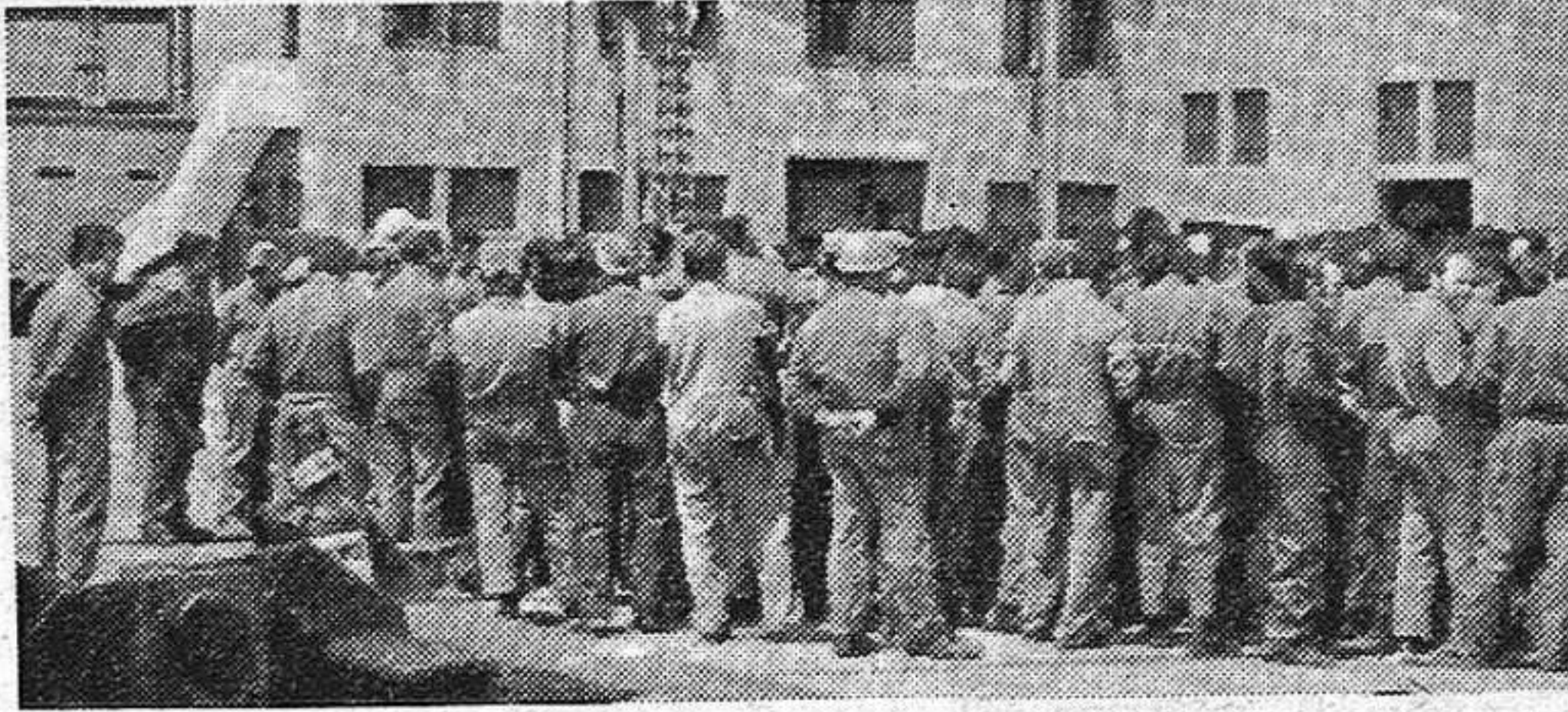
La lucha unida, por reivindicaciones comunes es la única salida para acabar con la angustiosa situación actual.

Todas ellas tienen rasgos comunes que es conveniente analizar. En primer lugar, su carácter unitario; todos los trabajadores y las centrales sindicales se han unido en la defensa de una plataforma reivindicativa común y esto es importante por encima de que alguna central sindical, como la C.S. de CC.OO. haya tratado de ponerle freno a la lucha, como ha ocurrido en Asturias. En segundo lugar, la firmeza y decisión de los trabajadores en la defensa de sus reivindicaciones, que ha obligado a sentarse en la mesa de negociaciones a la patronal que no quería hacerlo, como en Cáceres, o a que hagan concesiones aunque todavía no las que necesitan los trabajadores. En tercer lugar, las formas de lucha desarrolladas: las asambleas regulares en que todos los trabajadores tienen