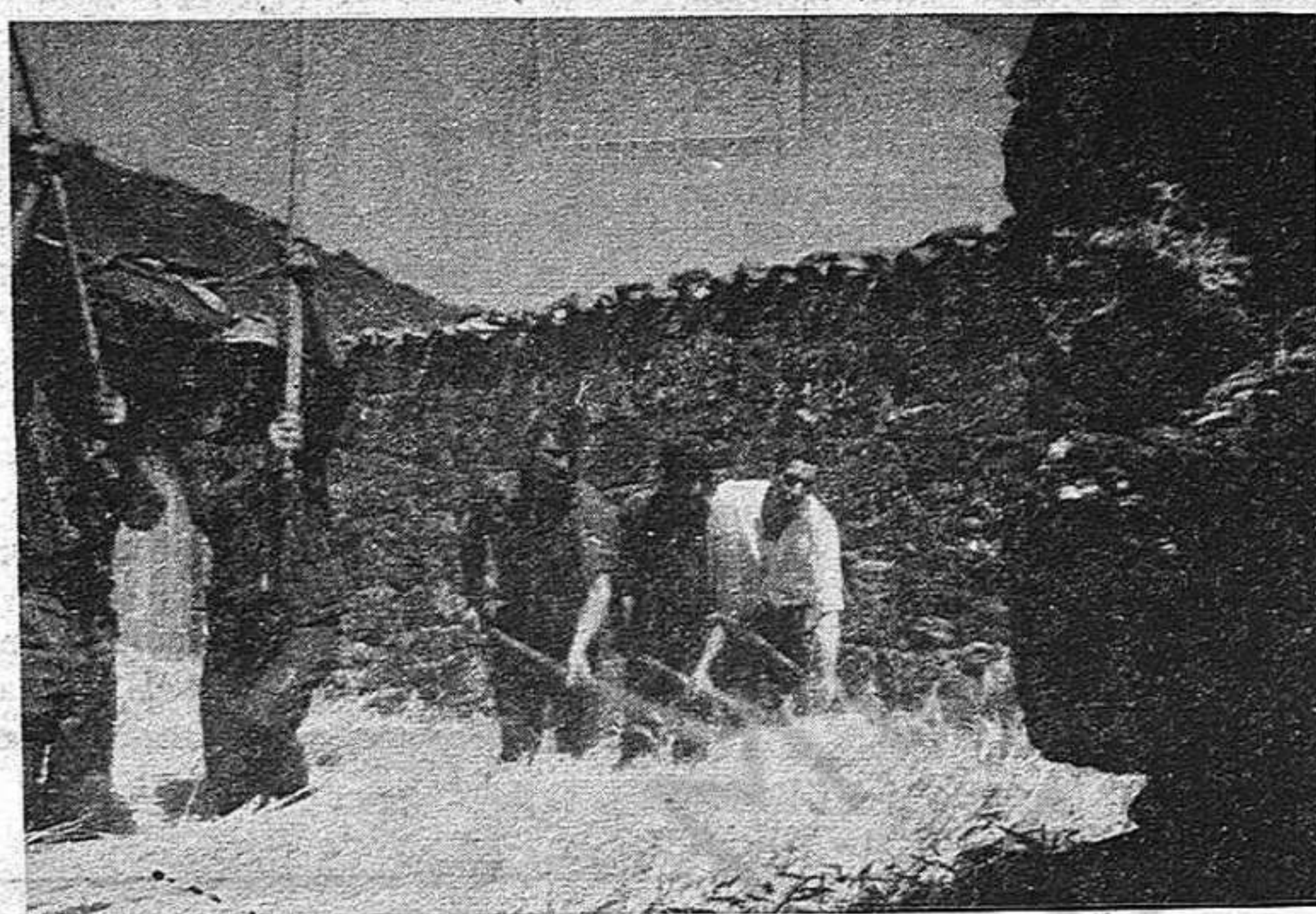
Los campesinos sólo tienen la salida de unir sus fuerzas a las de los jornaleros y demás sectores del pueblo. Así anularán el Pacto de la Moncloa y podremos salir de la crisis.

La aplicación de este decreto permitiría al Gobierno continuar fijando la política agraria de espaldas a los campesinos, mantener parte del aparato del sindicalismo vertical en el campo y reducir a la mínima expresión la posibilidad de que los campesinos participen en la elaboración y aplicación de una política agraria que tenga en cuenta sus intereses, frenando el desarrollo de las organizaciones campesinas democráticas y fo-