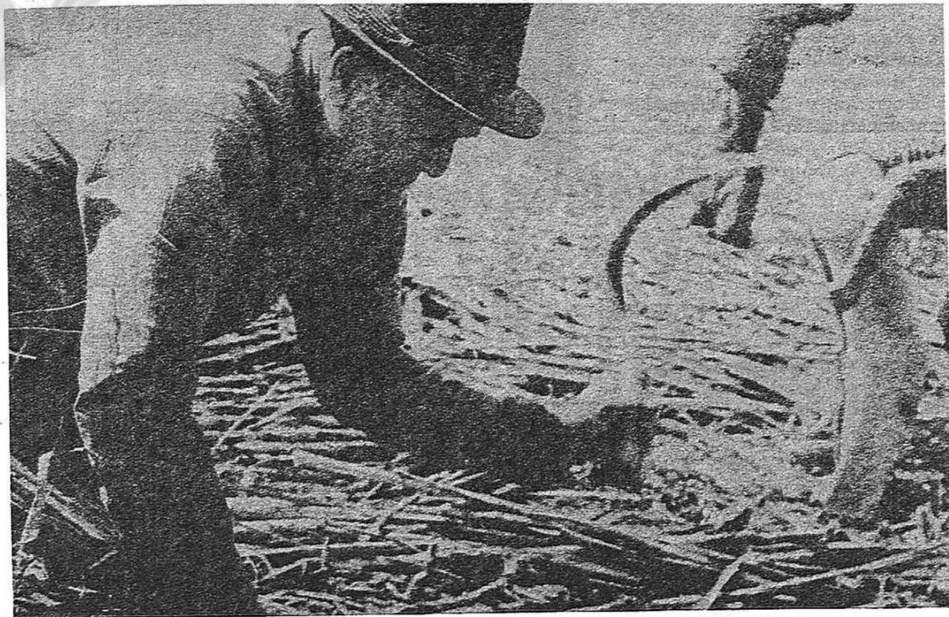
Andalucía quiere un Estatuto de Autonomía que garantice los intereses del pueblo, dándole capacidad para ser gestor de sus propios asuntos. Para acabar con la miseria del campo andaluz, con el paro...

No basta con el llamamiento hecho en el último comuni-