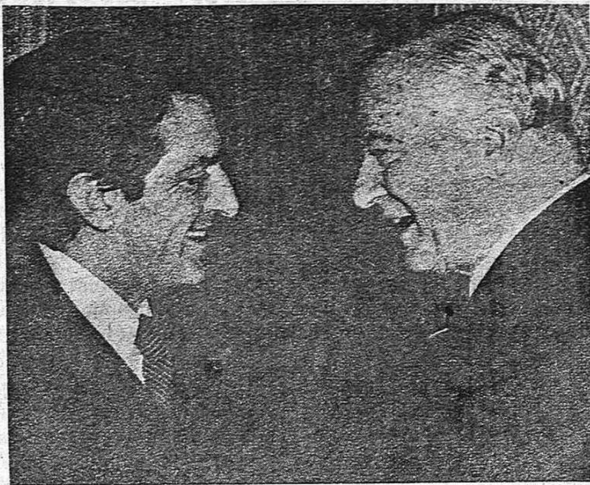
Aunque no como quería el pueblo, Tarradellas vuelve a Barcelona.

En un comunicado público del Comité Nacional de Catalunya del 21-10-77 se dice: "la ORT saluda el retorno del señor Josep Tarradellas como President de la Generalitat provisional. Consideramos positiva su vuelta en la medida que constituye un avance en la puesta en vigor de los acuerdos alcanzados el 29 de septiembre".