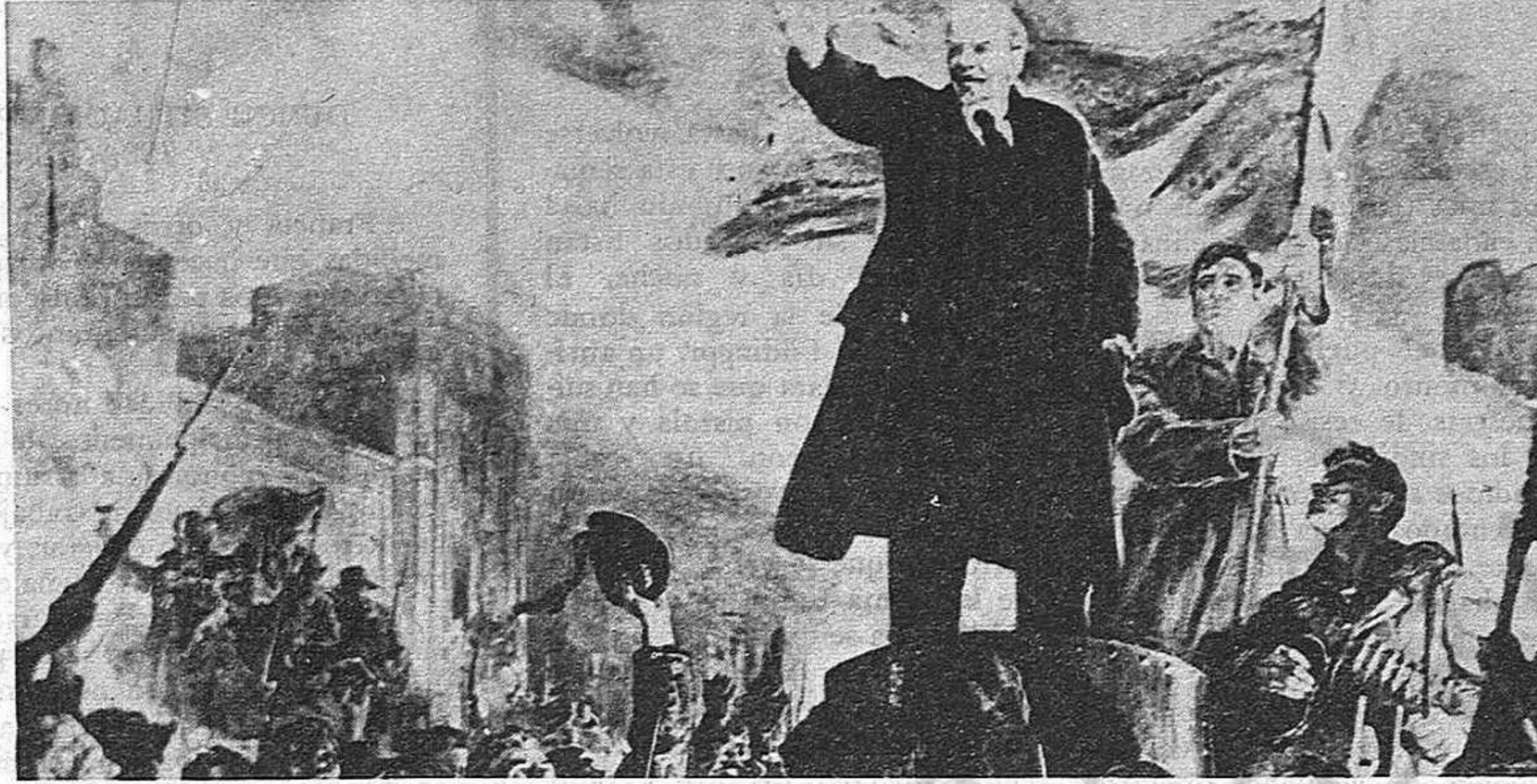
La Revolución Socialista de Octubre en Rusia, encarna la teoría marxista-leninista y sus enseñanzas tienen valor universal.

A partir del próximo número de En Lucha, aparecerán una serie de artículos conmemorativos de la Revolución Socialista de Octubre, analizando temas tan importantes como: la experiencia de la construcción del socialismo en la URSS, la degeneración de la dictadura del proletariado y la restauración del capitalismo en la URSS y su conversión en potencia socialimperialista.