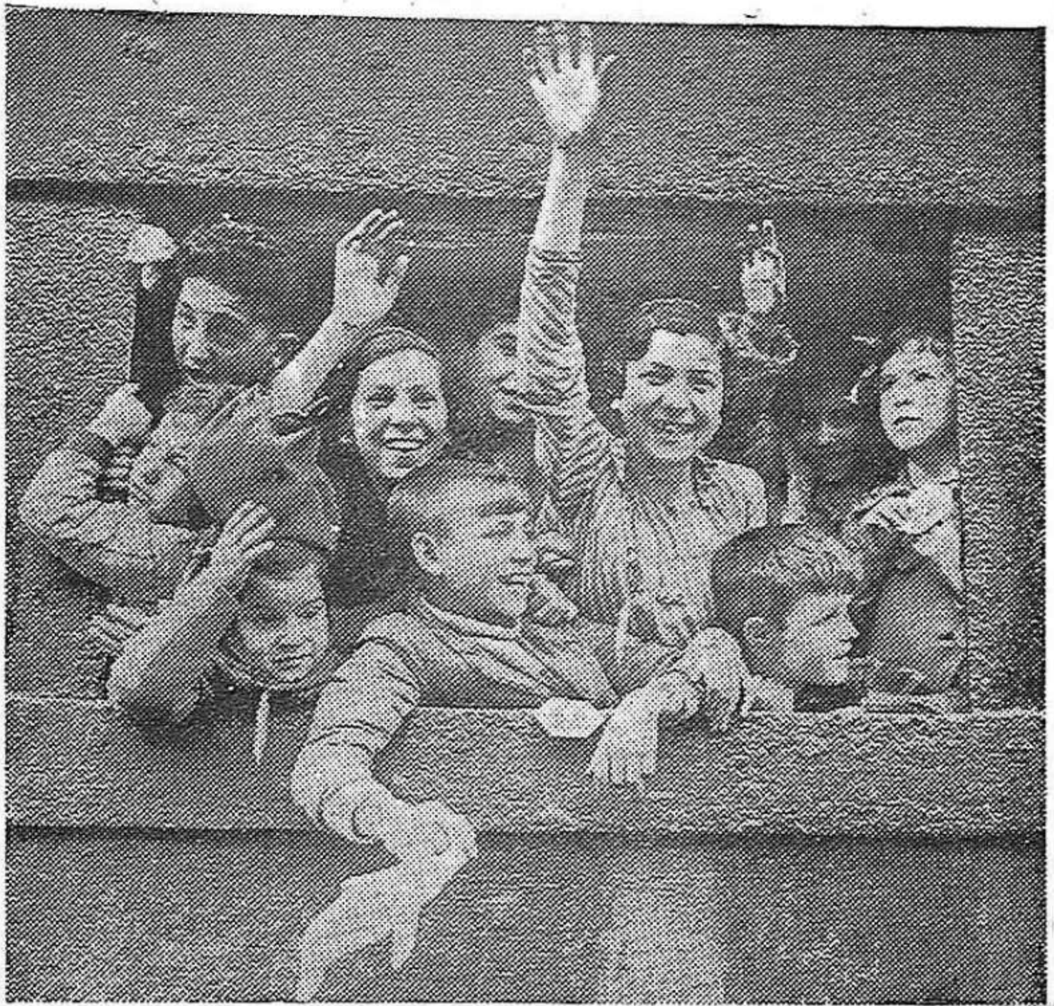
Huyendo de los barbaros bombardeos franquistas e italo-alemanes, los niños de Bilbao embarcan con destino a Inglaterra, donde desde ninos conocieron todos los sinsabores de un exilio prematuro. En sus rostros se refleja la alegría de escapar al terror de las sirenas, y de las explosiones de las bombas, pero en no pocas figuras infantiles se traduce la pena de abandonar a sus seres queridos, de separarse de sus madres, que quedaban en tierra.