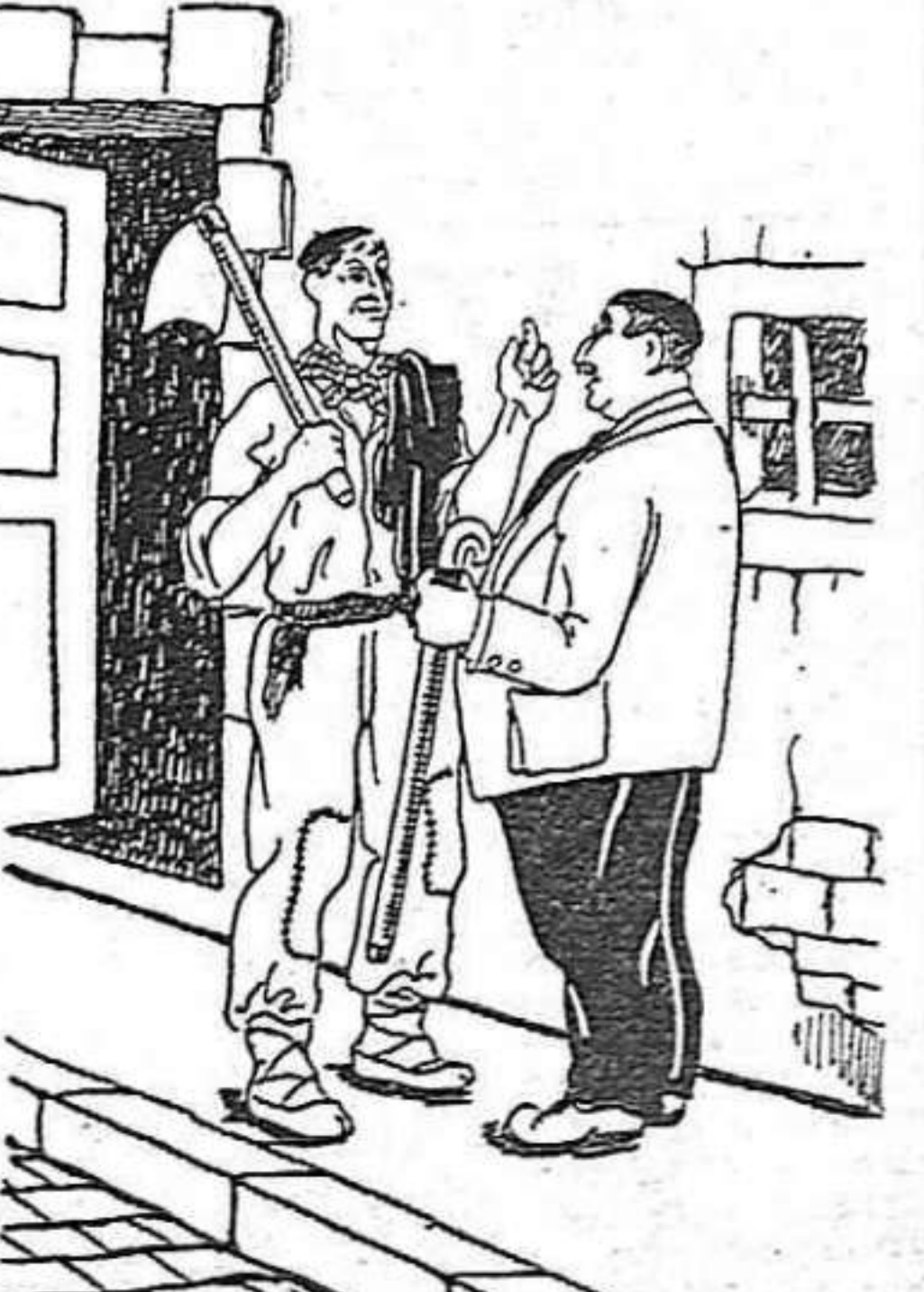
— Ya entiendo D. Lusiano; hasta ahora solo me hablabas de G.L.O. RIOSOS MOVIMIENTOS y ahora se lamenta de MALDITOS PAROS. — Vaya frenaso? eh?