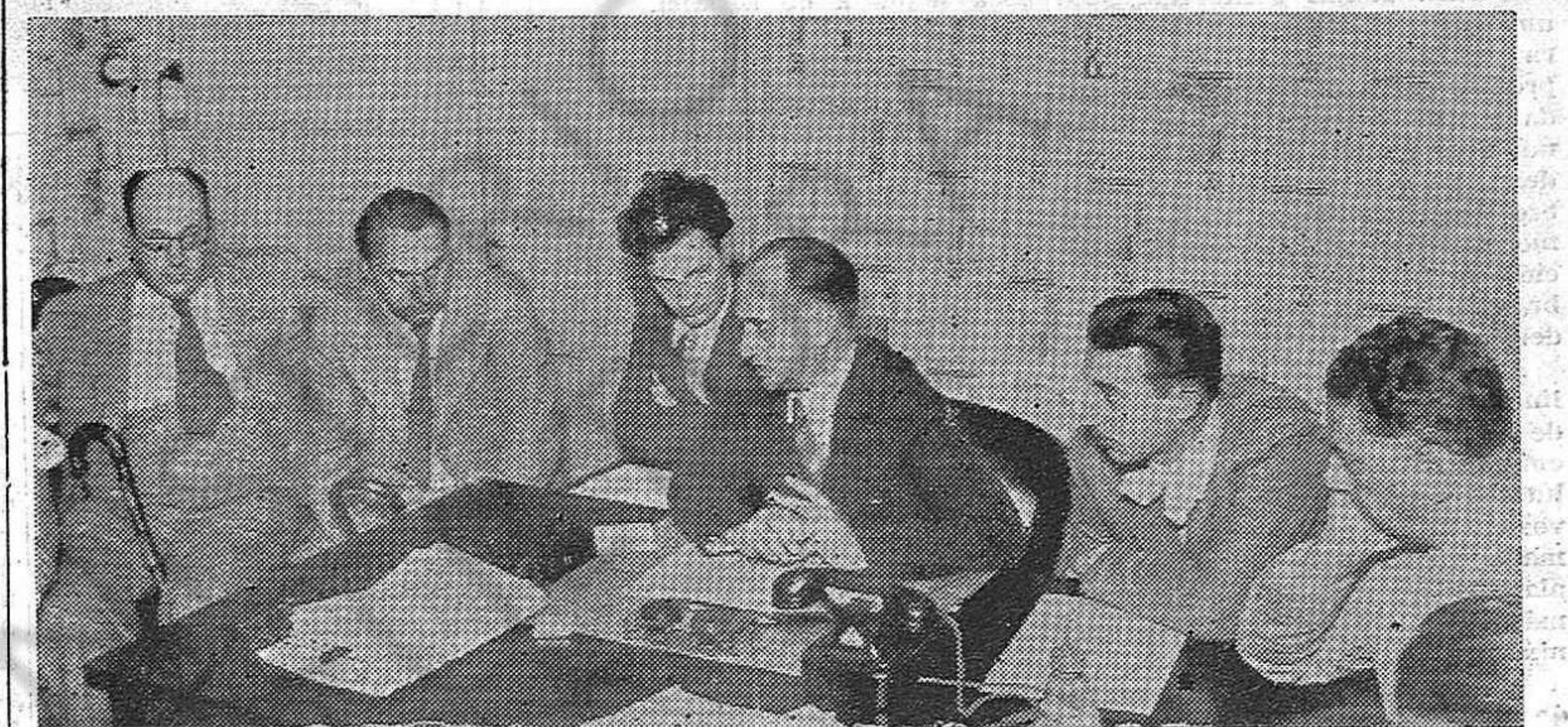
El poeta Chileno Pablo Neruda, en la visita que realizó días pasados al Comité Nacional Pro Defensa de la República Democrática Española departiendo con dirigentes de la entidad