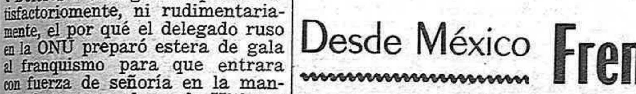
la fuerza generosa del régimen