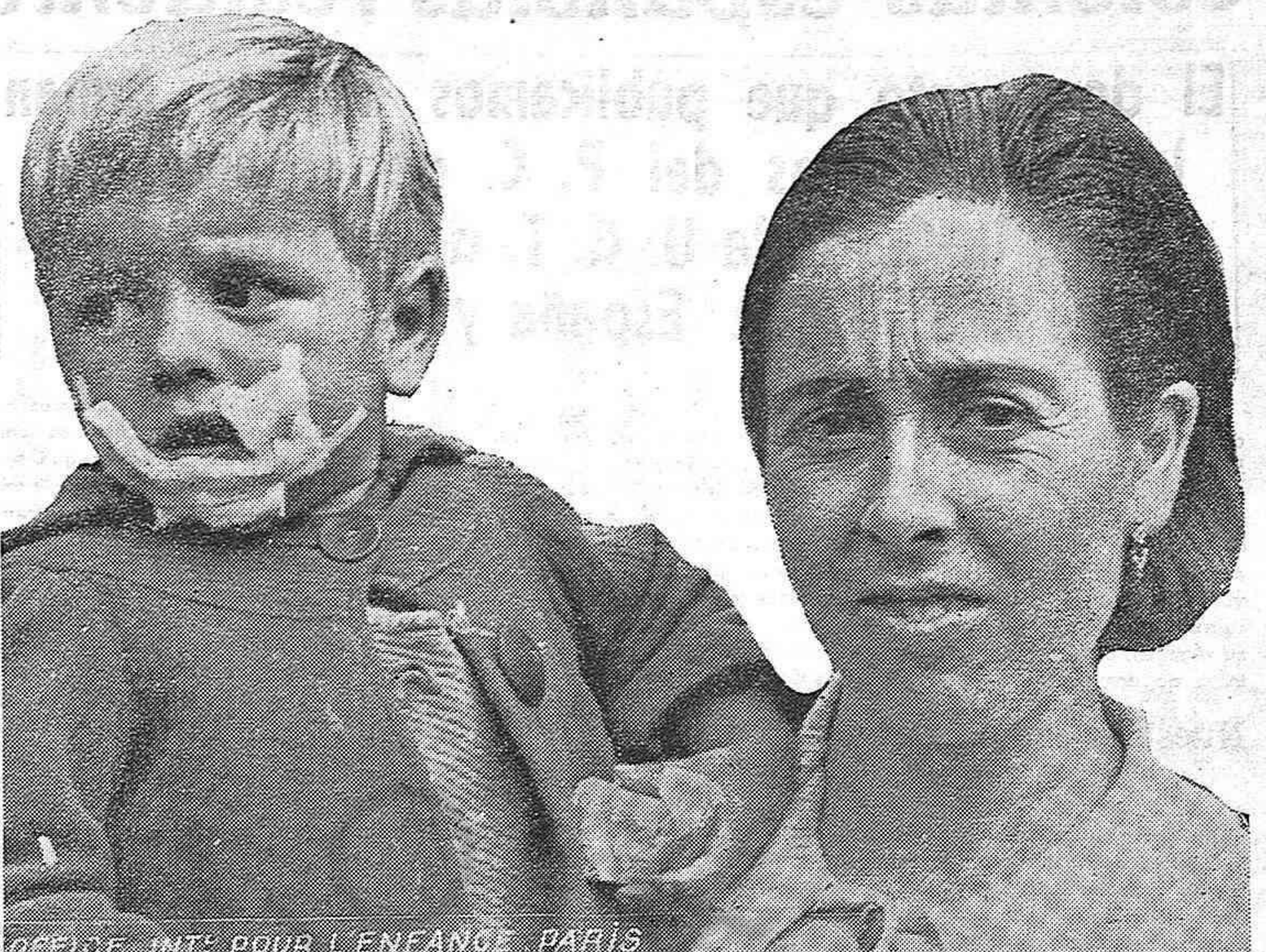
Millares de mujeres y niños españoles están siendo entregados a Franco y otros pereciendo en territorio francés de hambre y de frío. Todo nuestro pueblo y la colectividad española, a la cabeza de ambos la mujer uruguaya, debe contribuir a salvarlos.