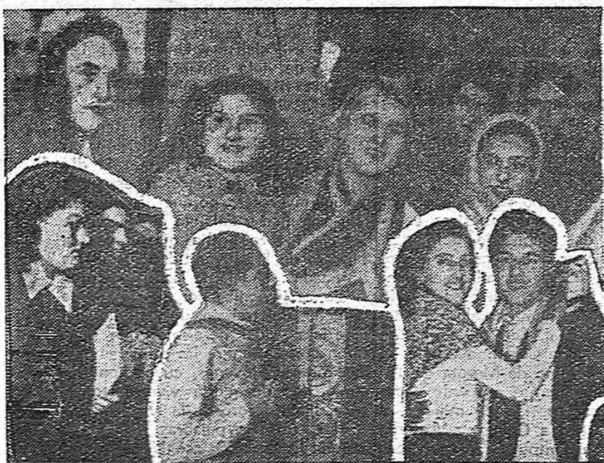
Diversos aspectos de uno de los festivales de la Conferencia

Después de la sesión del viernes por la tarde, celebrese un concurso de danzas y canciones, primero de los intermedios artísticos y recreativos que fueron intercalados en el programa de la Conferencia y que contribuyeron a darle una brillantez y un carácter auténticamente juvenil sin precedente en los anales de la emigración española.