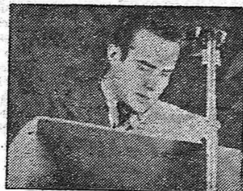
ABELLA, antiguo joven libertario dice:

nos a la unidad y a la victoria contra Franco y Falange. ¡Viva la promoción «7 de Noviembre»! ¡Viva la J.S.U.!»