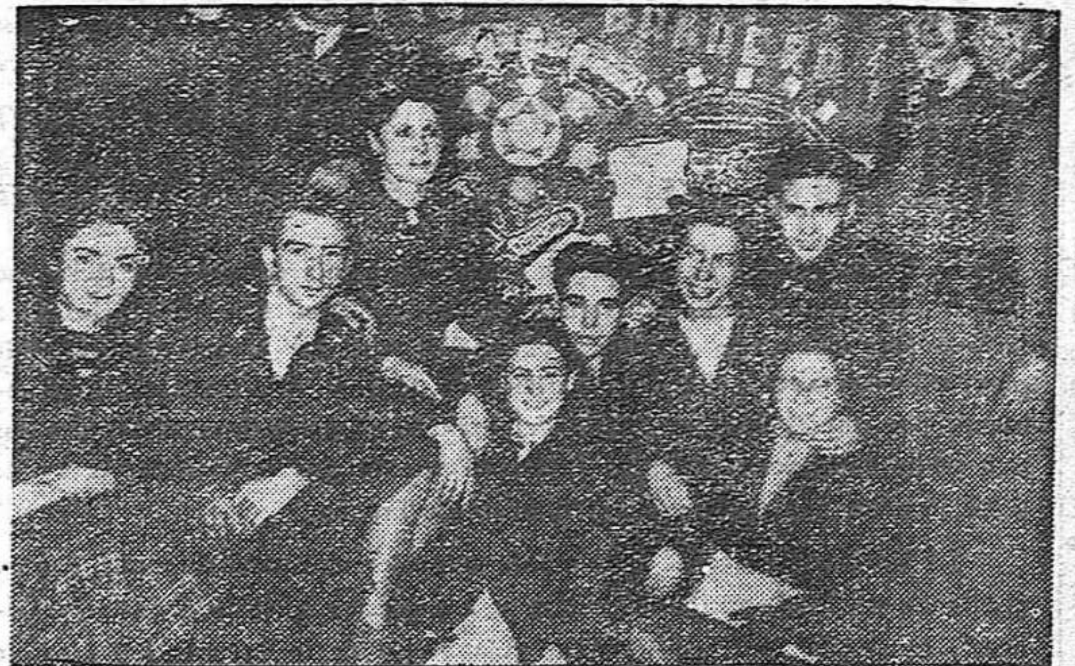
Un grupo de jóvenes junto al periódico mural del Alto Garona que fue premiado por la Conferencia

Termina prometiendo hacer llegar las resoluciones de la Conferencia a toda la juventud española en Africa, reclutar rápidamente un centenar de nuevos militantes, recaudar 100.000 francos mensuales.