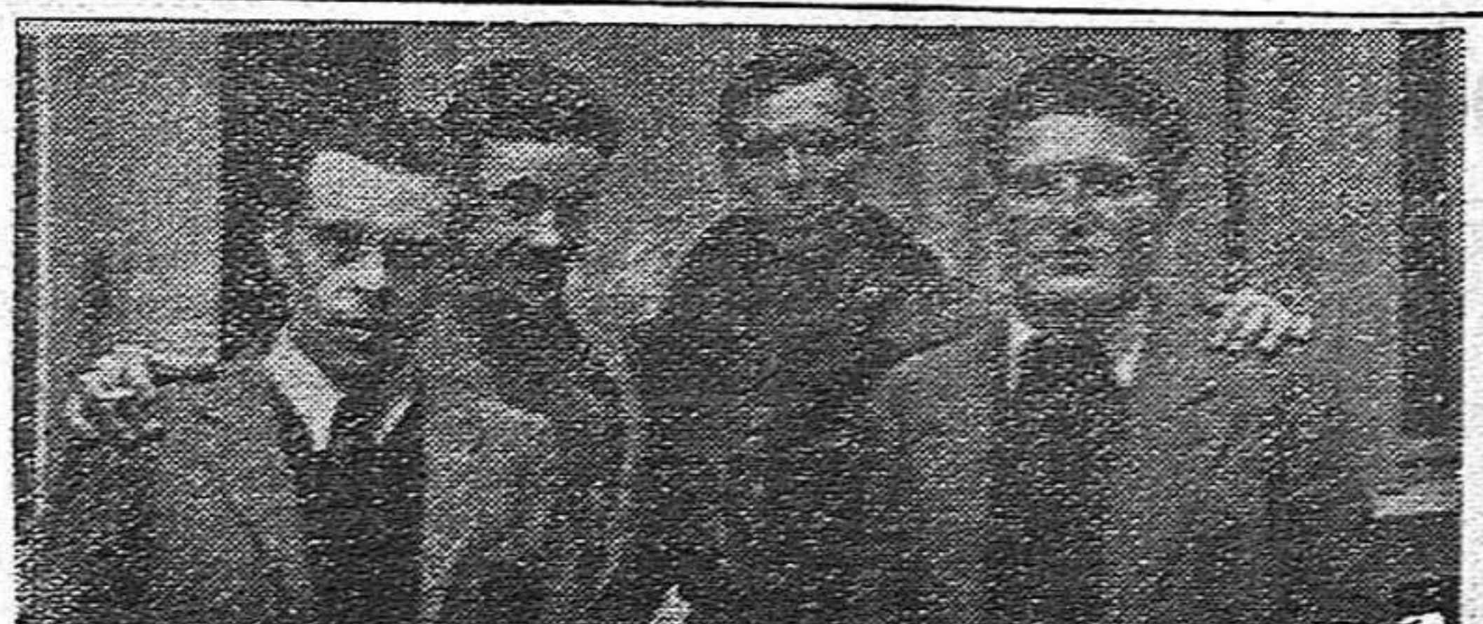
Grupo de guerrilleros al final de una de las sesiones de la Conferencia

Señaló la actividad clandestina de la gloriosa F.U.E., que se mantiene fiel a su tradición combativa y en cuyo seno se reúnen los estudiantes de las más diversas tendencias antifranquistas. «Queremos — dijo — una Universidad abierta de par en par a la juventud. Y unos estudiantes que fraternamente unidos a toda la juventud de España, avancen, alegres y audazmente, a la conquista del futuro.»