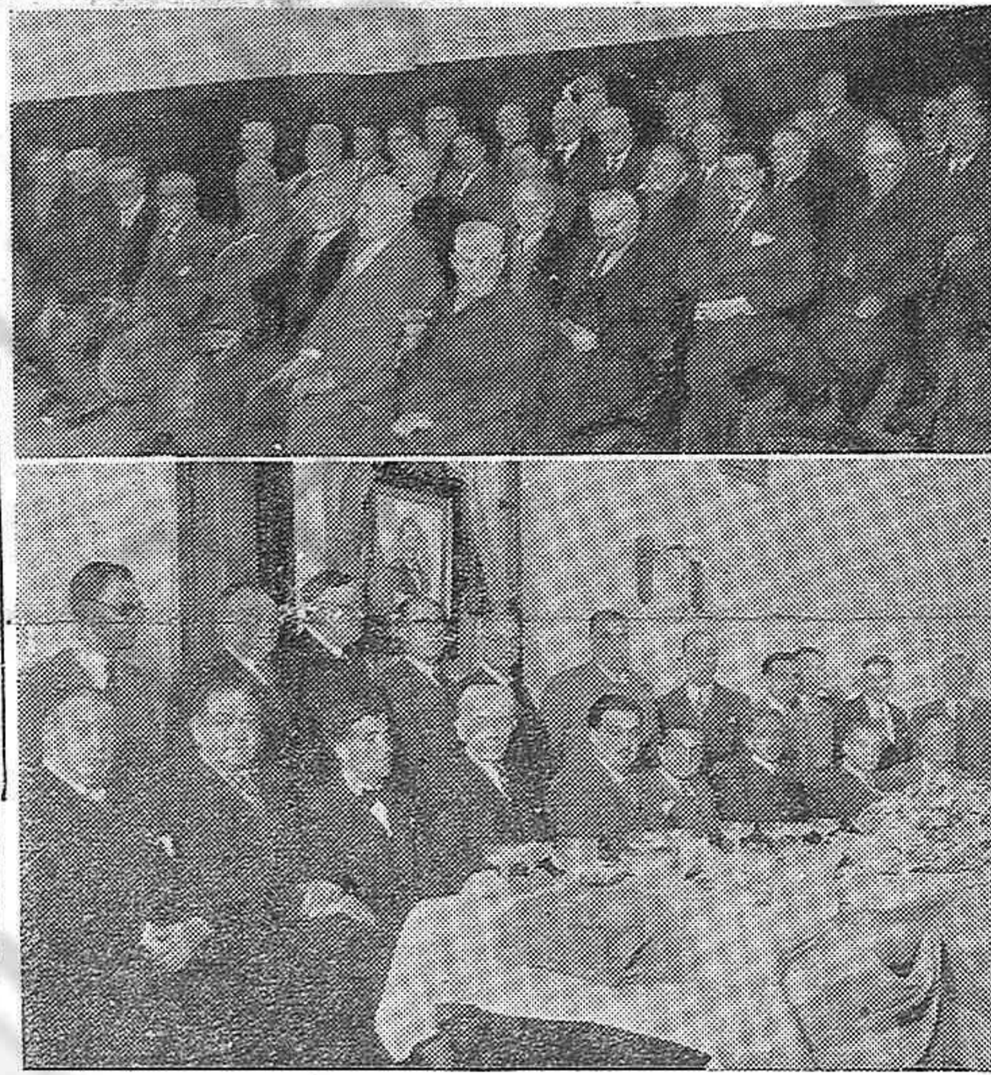
La Asociación Española Primera de Socorros Mutuos celebró el 87 aniversario de su fundación. En esta nota gráfica aparecen: (arriba) Mutualistas que llevan 50 años en la entidad y a los que la Directiva de la misma ha distinguido con la entrega de una medalla de plata; (abajo) Miembros de la Directiva de la Asociación en el acto de servir un lunch a los veteranos mutualistas.

Una numerosa comisión integrada por mujeres y hombres del movimiento ayudista y de la colectividad española tiene a su cargo el enorme trabajo que implica la comida popular que tenemos programa como conmemoración y que será, además, de homenaje al movimiento de ayuda, a la colonia y al pueblo español.