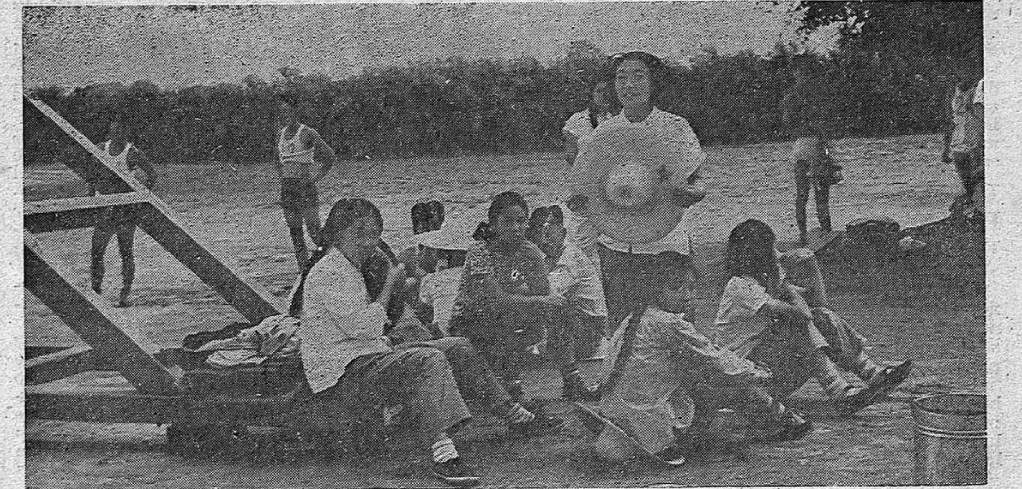
En una aldea china.