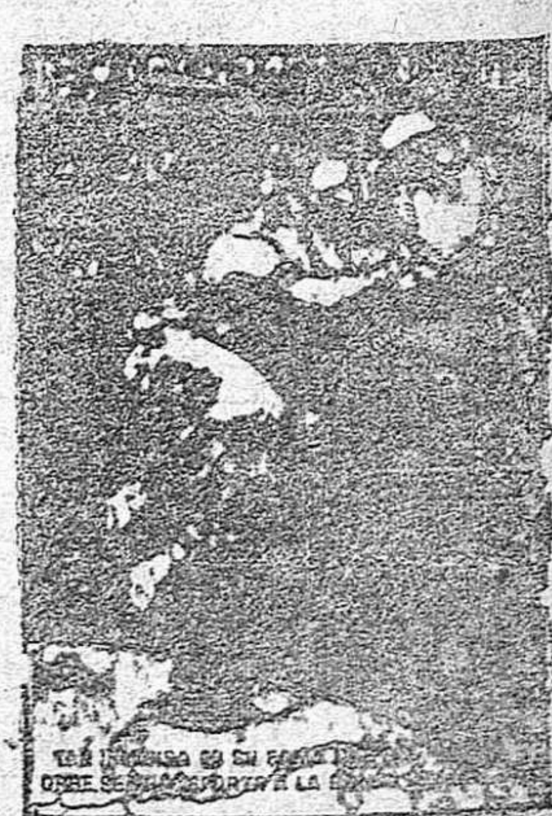
El Fordson es el tractor que se adapta a todos los trabajos agrícolas.

BILBAO, CALVO & COMPANIA.—Plaza Elíptica, núm. 2; BILBAO