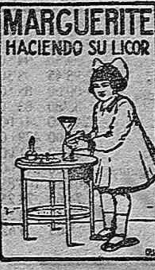
MARGUERITE HACIENDO SU LICOR