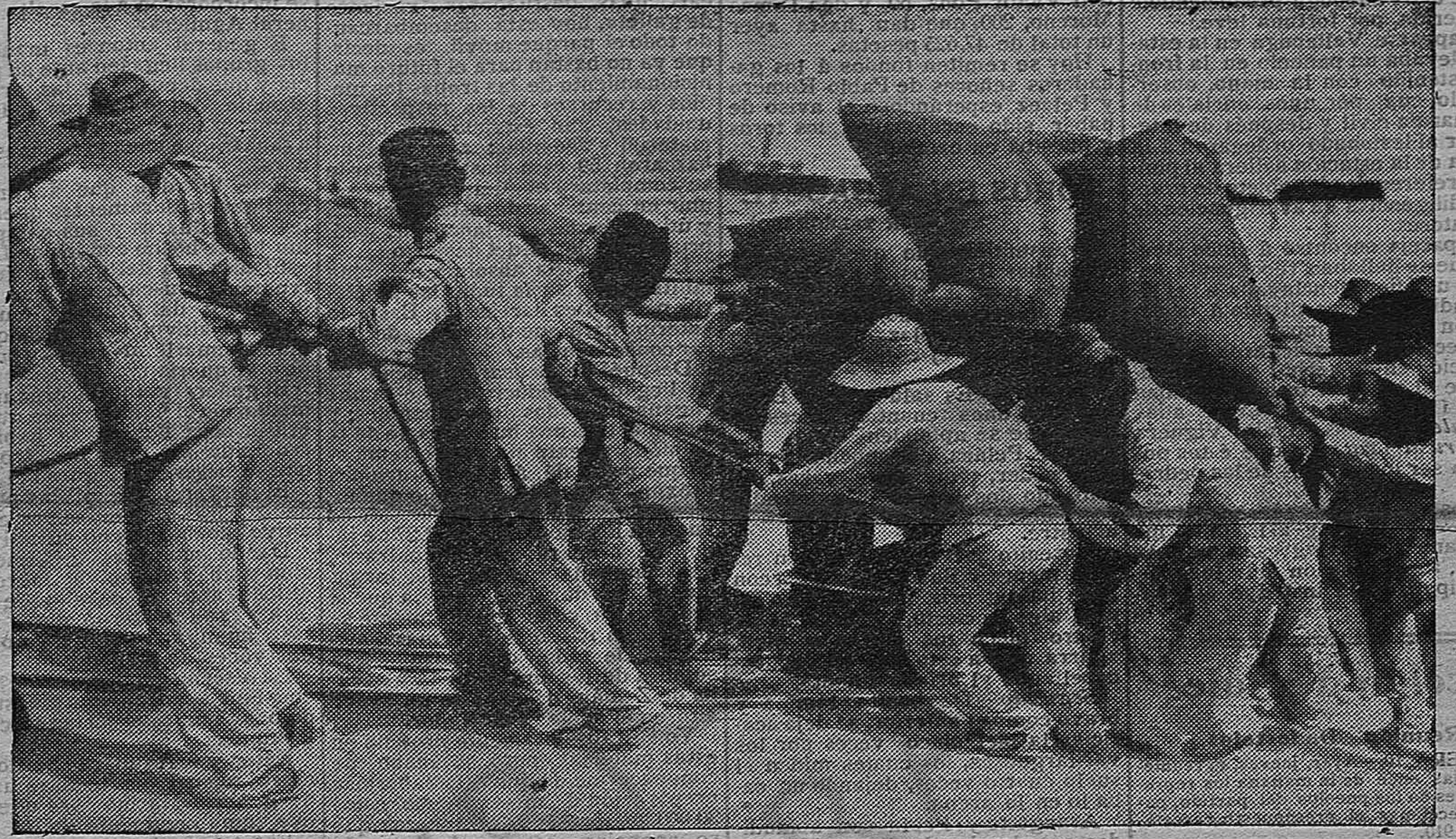
Los soldados desembarcando viveres en la Restinga, para el campamento del zoco El Arba