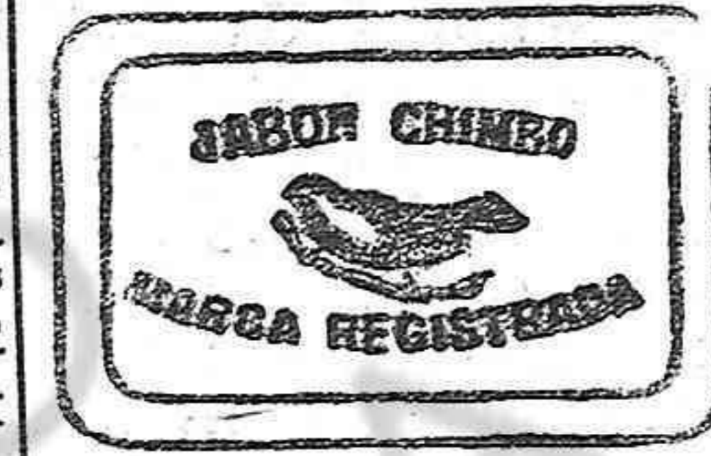
El mejor elogio de este jabón, está hecho por las innumerables mitaciones que ha tenido en el corto espacio de dos años que cuenta de existencia. Para obtener un jabón bueno, higiénico, económico y eficaz, en el país existe la fábrica de la marca Chimbo, estampada en el trozo. Fabricación especial de la Antigua Jabonera Tapia y Sobrino, de Bilbao.

Se necesita, que sepa cumplir con su obligación, en Villafranca (Navarra) Ganará 15 ptas. mensuales. Informa Juan Navaz en Villafranca