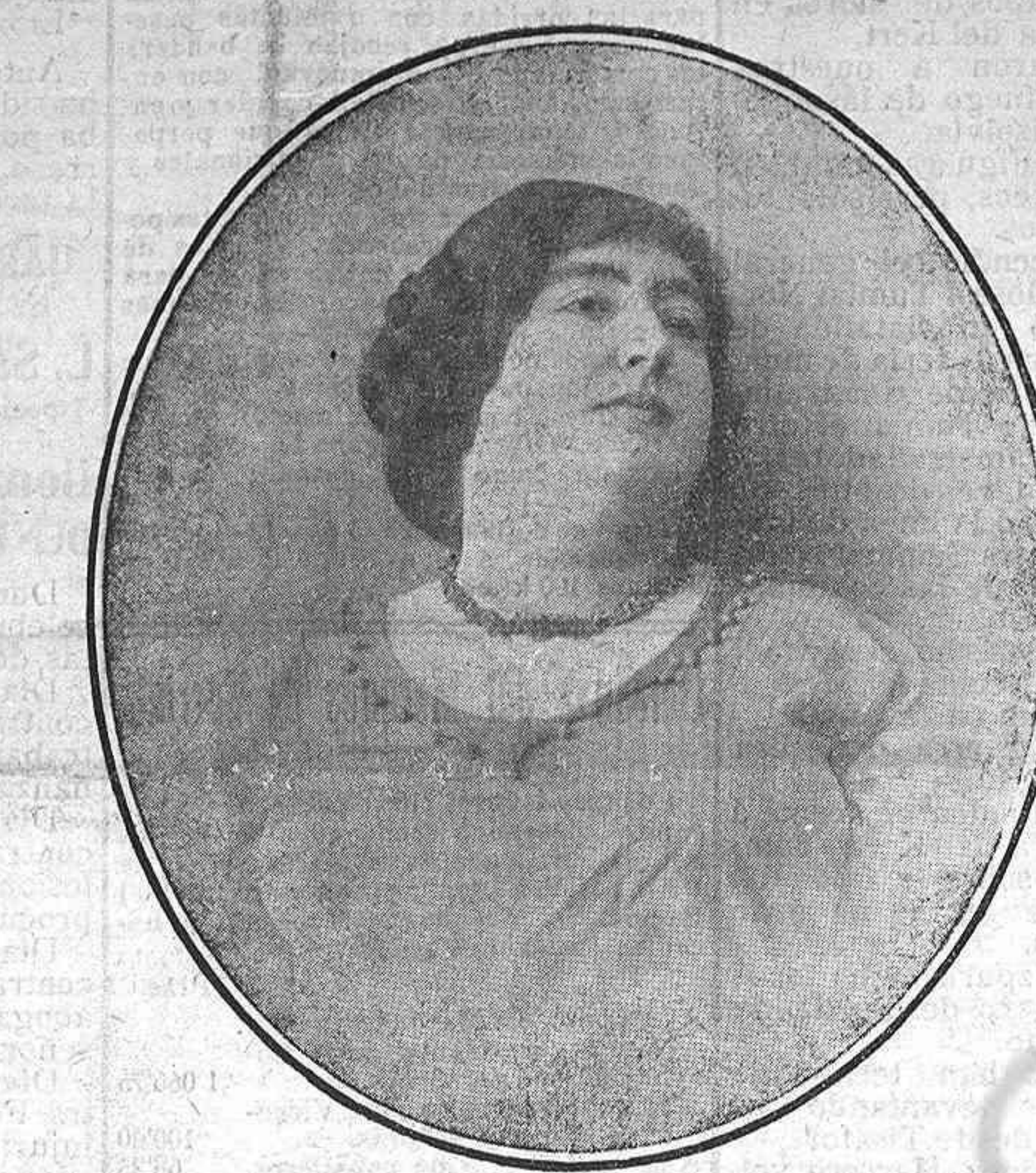
DOÑA CARMEN DE BURGOS (COLOMBINE)

Todos los pueblos antiguos tenían su insignia y procuraban ostentarla en sus múltiples campañas.