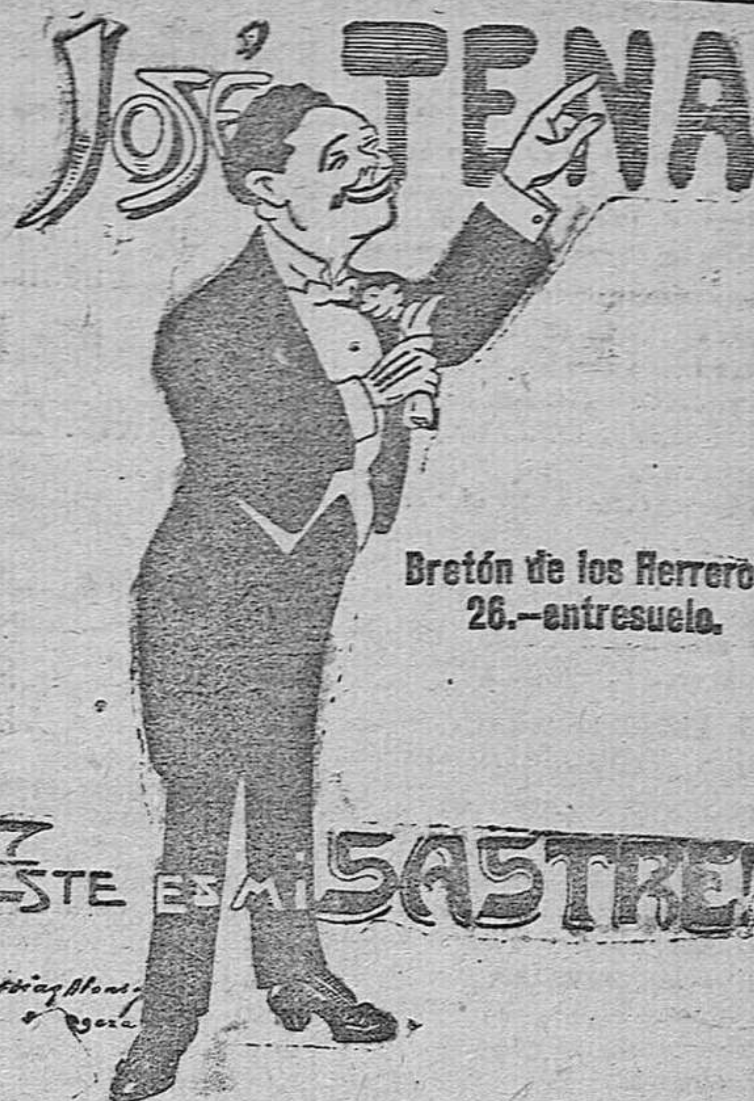
Bretón de los Herreros, 26.-entresuelo.