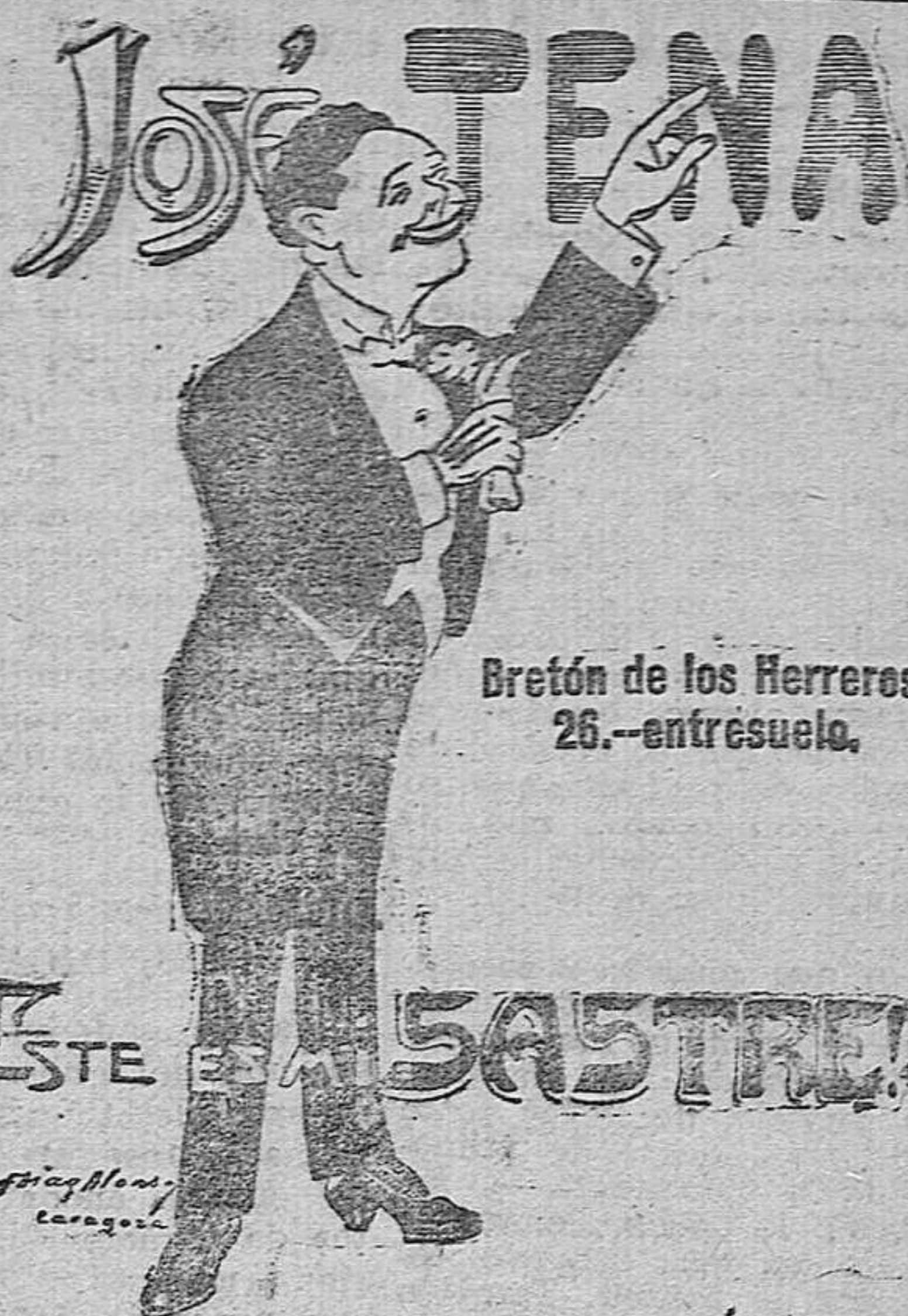
Bretón de los Herreros, 26.—entresuelo.

BANERAS. LAVABOS BIDETS. INODOROS JULIO REDON Marqués de Vallejo, número 17