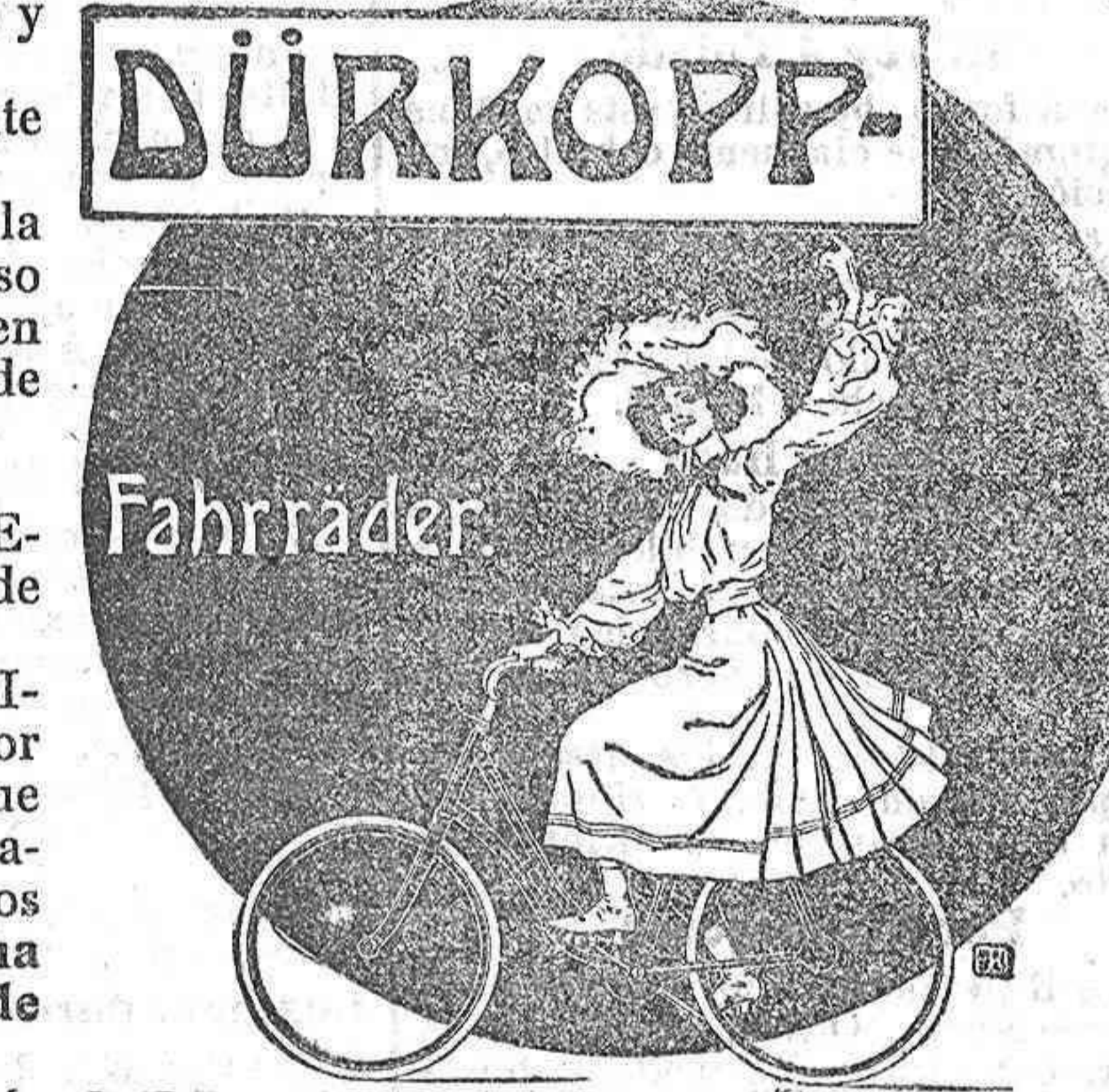
DÜRKOPP & CO. A. G. BIELEFELD