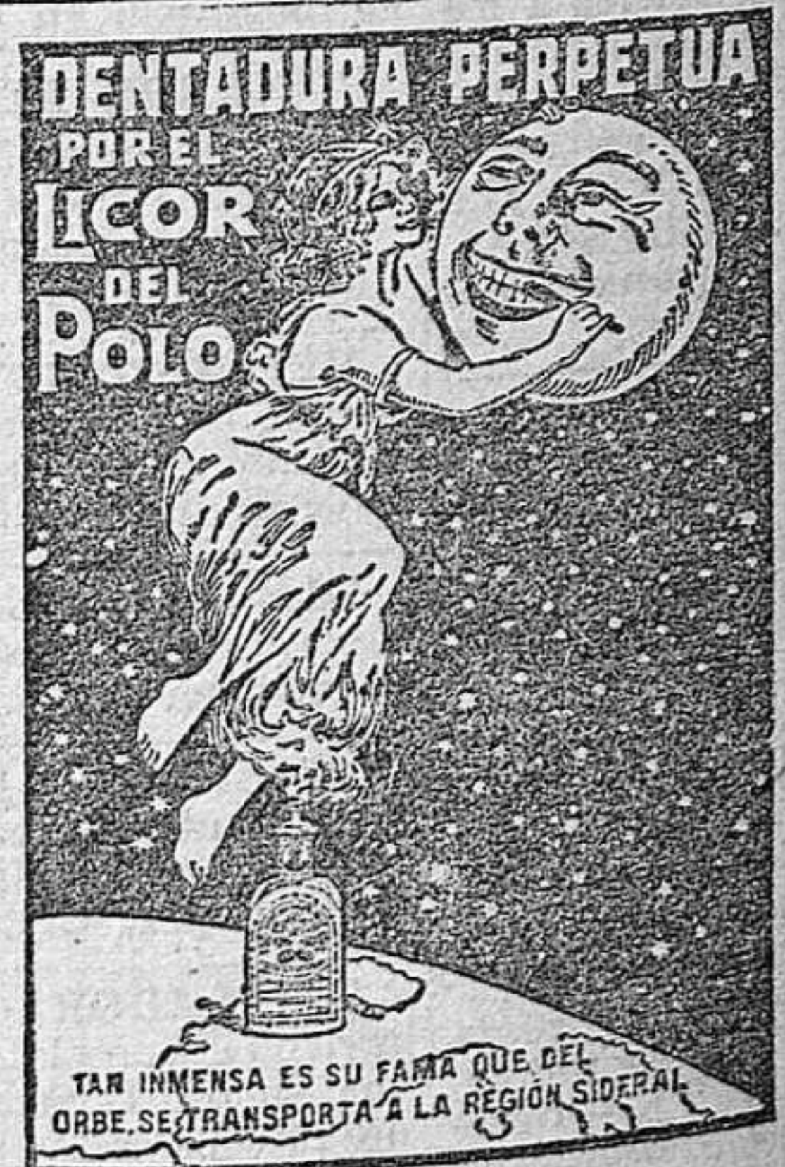
TAN INMENSA ES SU FAMA QUE DEL ORBE SE TRANSPORTA A LA REGION SIDERAL