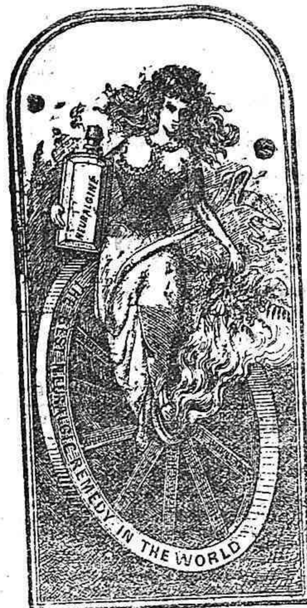
S. James Laboratory Eastville.