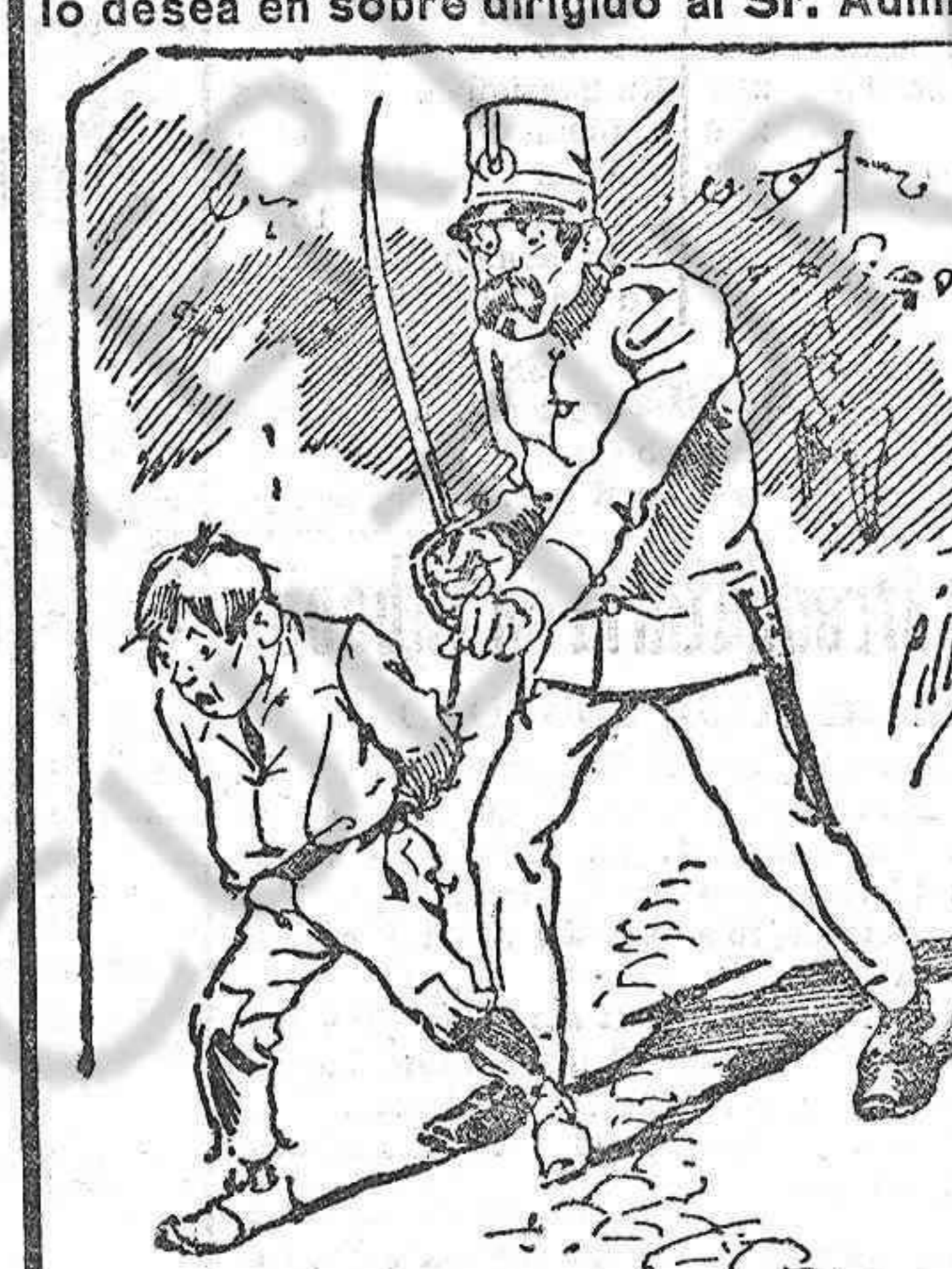
Tratamientos de la policía á nuestros vendedores cuando el número pica...

Depositarlos autorizados en Logroño, Sres. Hijos de Alesón, Portales, 90, Librería.