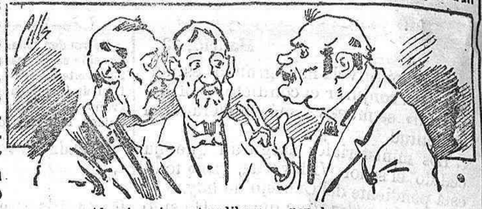
Abominan á nuestros libros... pero los compran.

fórmulas para toda clase de industria, y cuantas noticias y conocimientos puedan ser beneficiosos. Cuenta además con buenos grabados, parte liti- teraria excelente; da regalos mensuales á sus lectores con la Lotería Nacional y participa- ciones en la misma, á cuyo efecto compra todos los sorte- os, y en una de las Adminis- traciones más afortunadas por la suerte, billetes enteros. La suscripción y los números que se nos pidan se sirven gratuita- mente á correo vuelto y franqueados, con sólo indicar el nombre y dirección del que lo desea en sobre dirigido al Sr. Administrador de