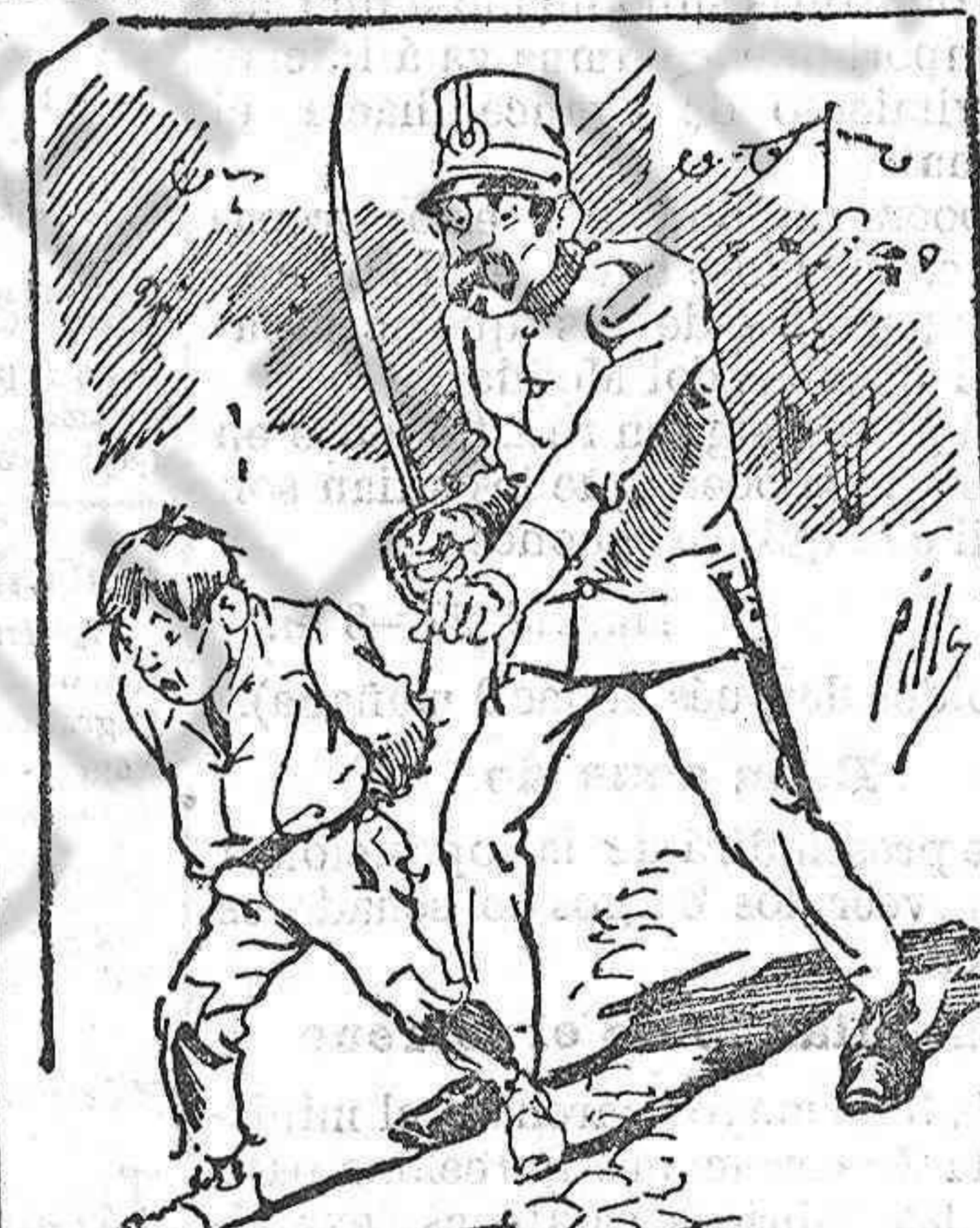
Tratamientos de la policía á nuestros vendedores cuando el número pica...

También puede pedirse LA AVISPA y el CATALOGO RESERVADO en casa de nuestros corresponsales autorizados, si no se quiere escribir á la Administración.