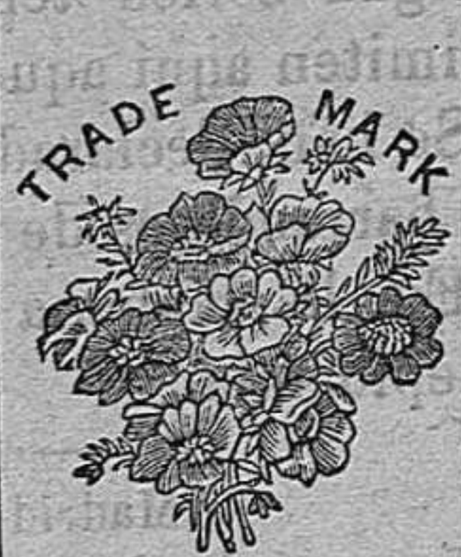
Flor de la Sabana de SEQUAH

Los muchos millares de certificados de personas que deben la curación de sus enfermedades á estos dos preparados y los brillantes elogios de varias corporaciones científicas del mundo entero, son el mejor elogio que pueda desearse.