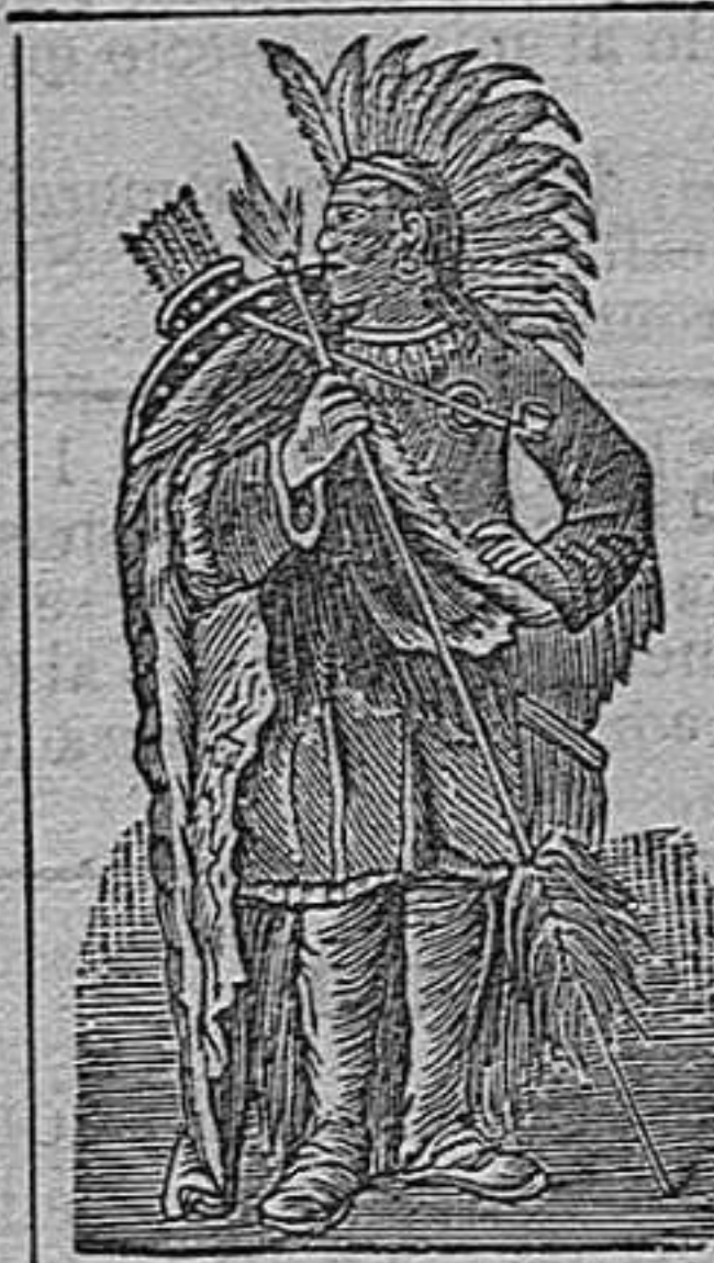
Aceite de SEQUAH

CURAN radicalmente las indigestiones, dispepsias, afecciones del hígado y de los riñones, ciática, asma, bronquitis, escrófulas, glándulas dilatadas, úlceras, gota, reumatismo, jaquecas, y limpian la sangre de toda impureza.