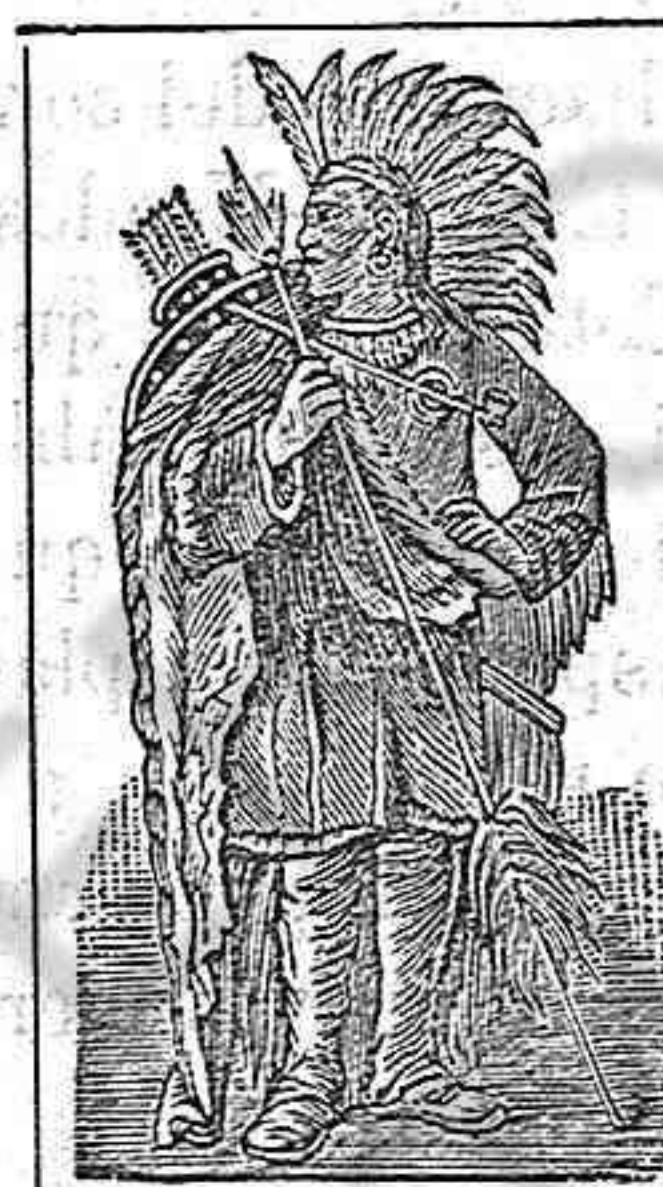
Acetoite de SEQUAH MARCA REGISTRADA