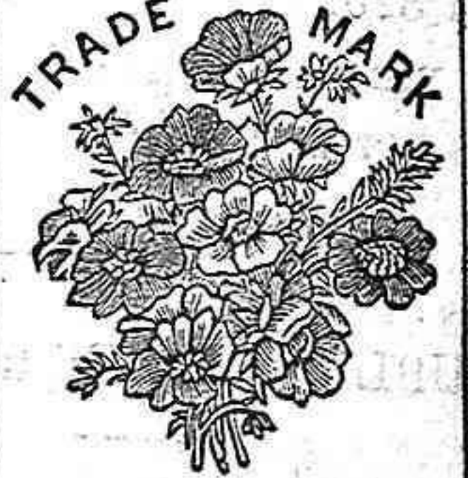
Flor de la Sabana de SEQUAH MARCA REGISTRADA

No contienen ninguna substancia nociva. Los muchos millares de certificados de personas que debían la curación de sus enfermedades á estos dos preparados y los brillantes elogios de varias corporaciones científicas del mundo entero, son el mejor elogio que pueda desearse.