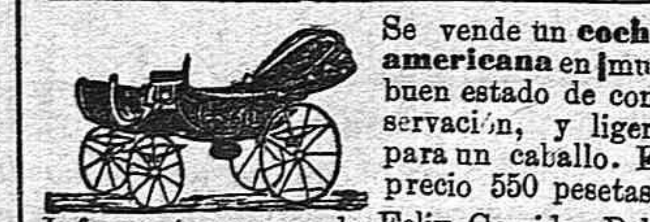
Se vende un coche americano en muy buen estado de conservación, y ligera para un caballo. El precio 550 pesetas. Informarán en casa de Felix Garrido, Delicias, 5.