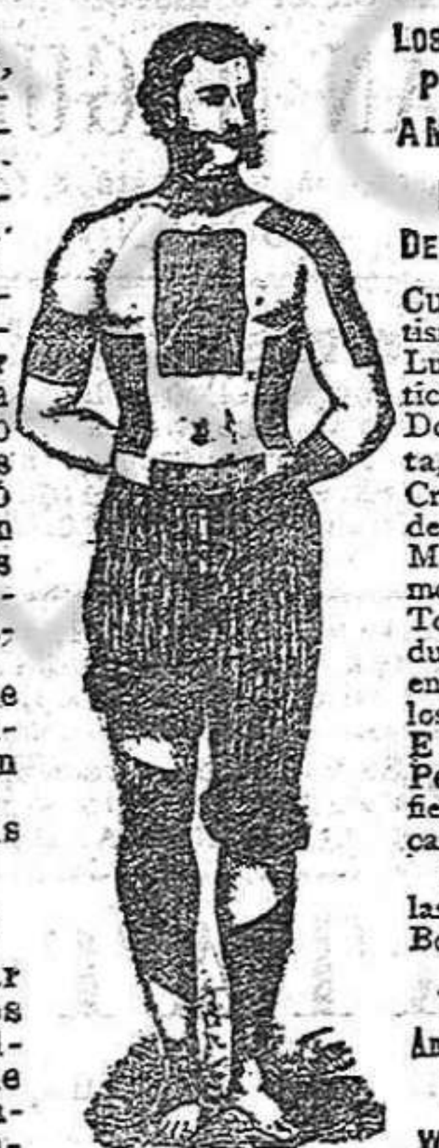
Trade Mark Registered

Los comerciantes, sacerdotes, estudiantes, mecánicos, empleados de ambos sexos, cuyos negocios les obligan á estar constantemente sentados ó expuestos á contraires dolores por falta de un ejercicio propio para sus miembros ó cuerpos, deben recurrir á los emplastos perforados del doctor Winter, en momento en que sienta náuseas, que se agudizan y desagradable que afecte sus cuerpos. Los EMPLASTOS PERFORADOS AMERICANOS FIETRO ROJO DEL DR. WINTER. Curan Rheumatismo, Neuralgia, Lumbago, Sciatica, Fiebre, Dolores de Garganta, Calambres, Croup, Dolores de Espalda, Pecho, Miembros, Pulmones, Estomago, Toses, Quebraduras, y todas las enfermedades de los poros de la piel. Emplastos Perforados de Fiebre Rojo Americano. De venta en las Droguerías y Boticas. THE WINTER'S American Scarlet Plak Perforated. WHOLESALE: NEW YORK. que son los recomendados por todos los médicos