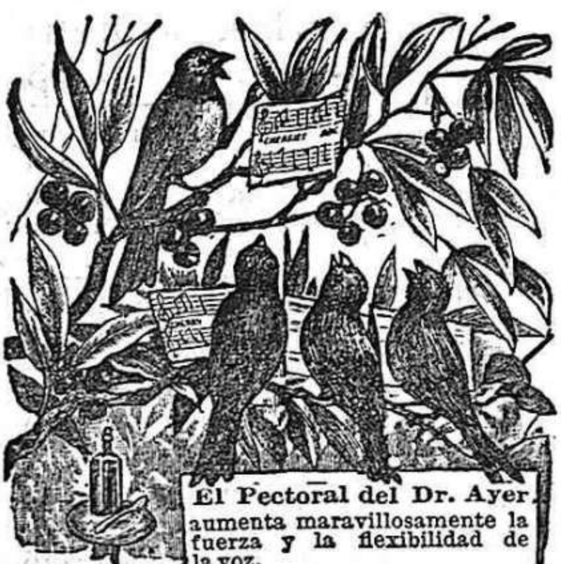
El Pectoral del Dr. Ayer aumenta maravillosamente la fuerza y la flexibilidad de la voz.