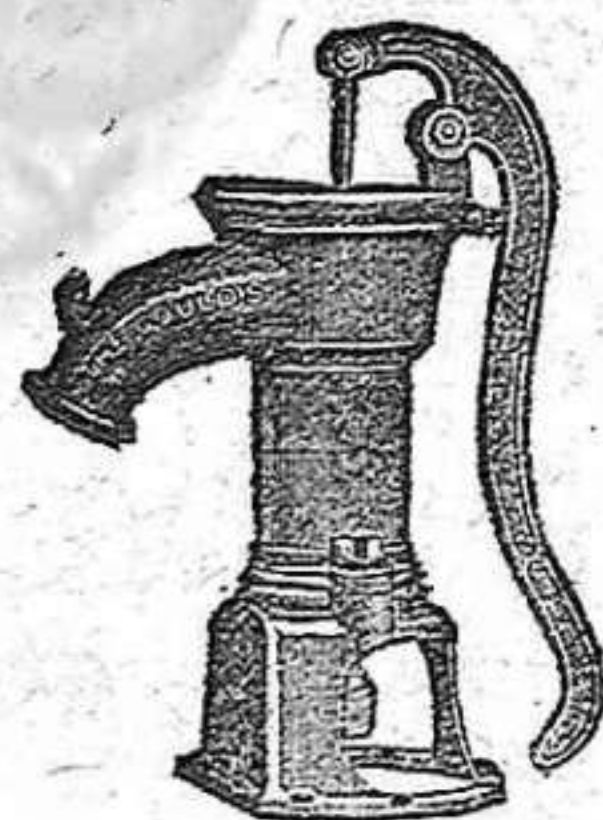
BOMBA PARA RIEGOS