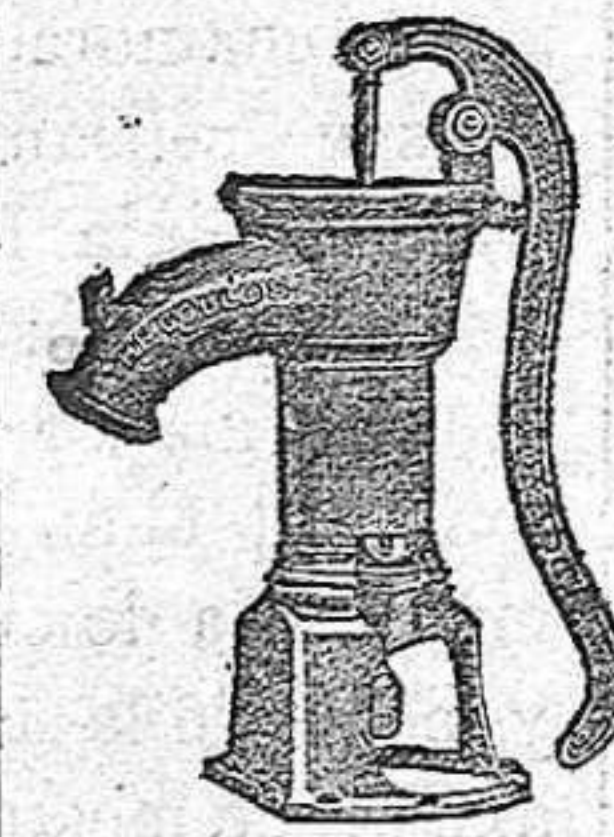
BOMBA PARA RIEGOS

Construye con solidez, economía y adelanto.