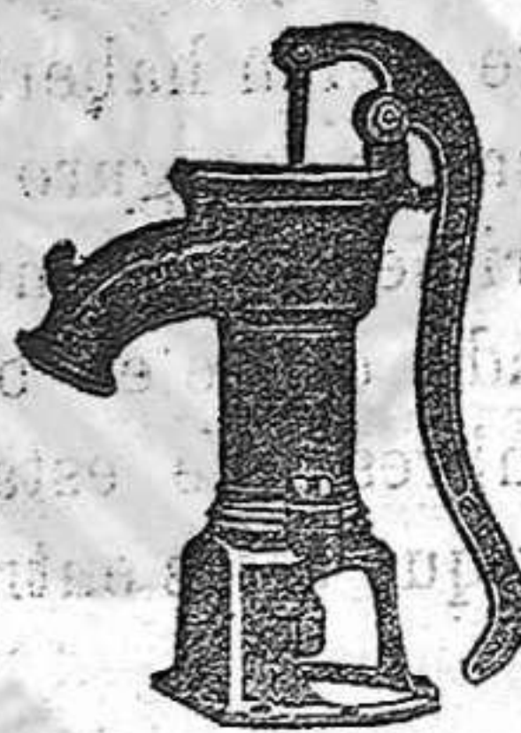
BOMBA PARA RIEGOS

Construye con solidez, economía y adelanto.