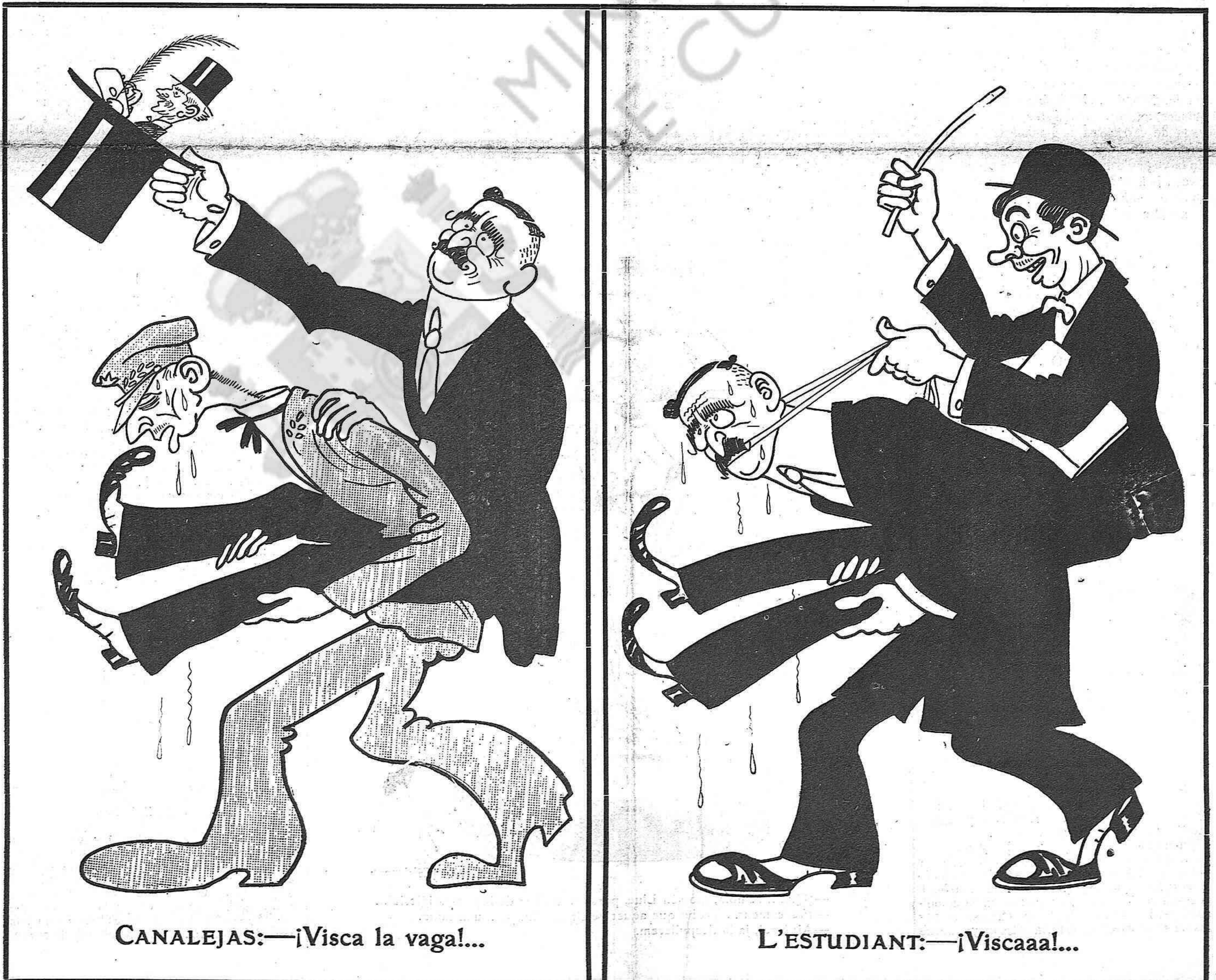
CANALEJAS:—¡Visca la vaga!...