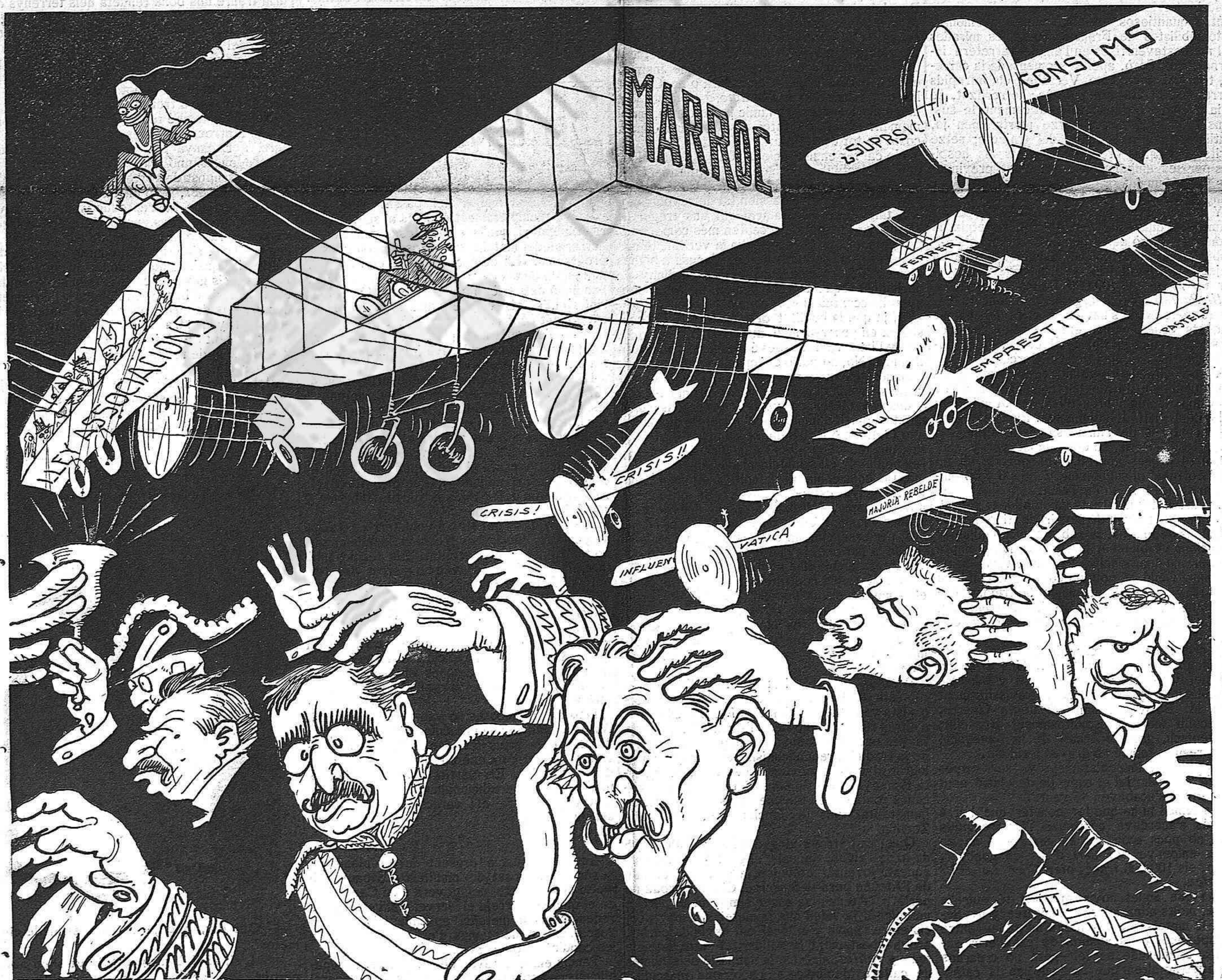
EN CANALEJAS:—¡Fugim, nois, que aquets aeroplans porten molt males intencions!...