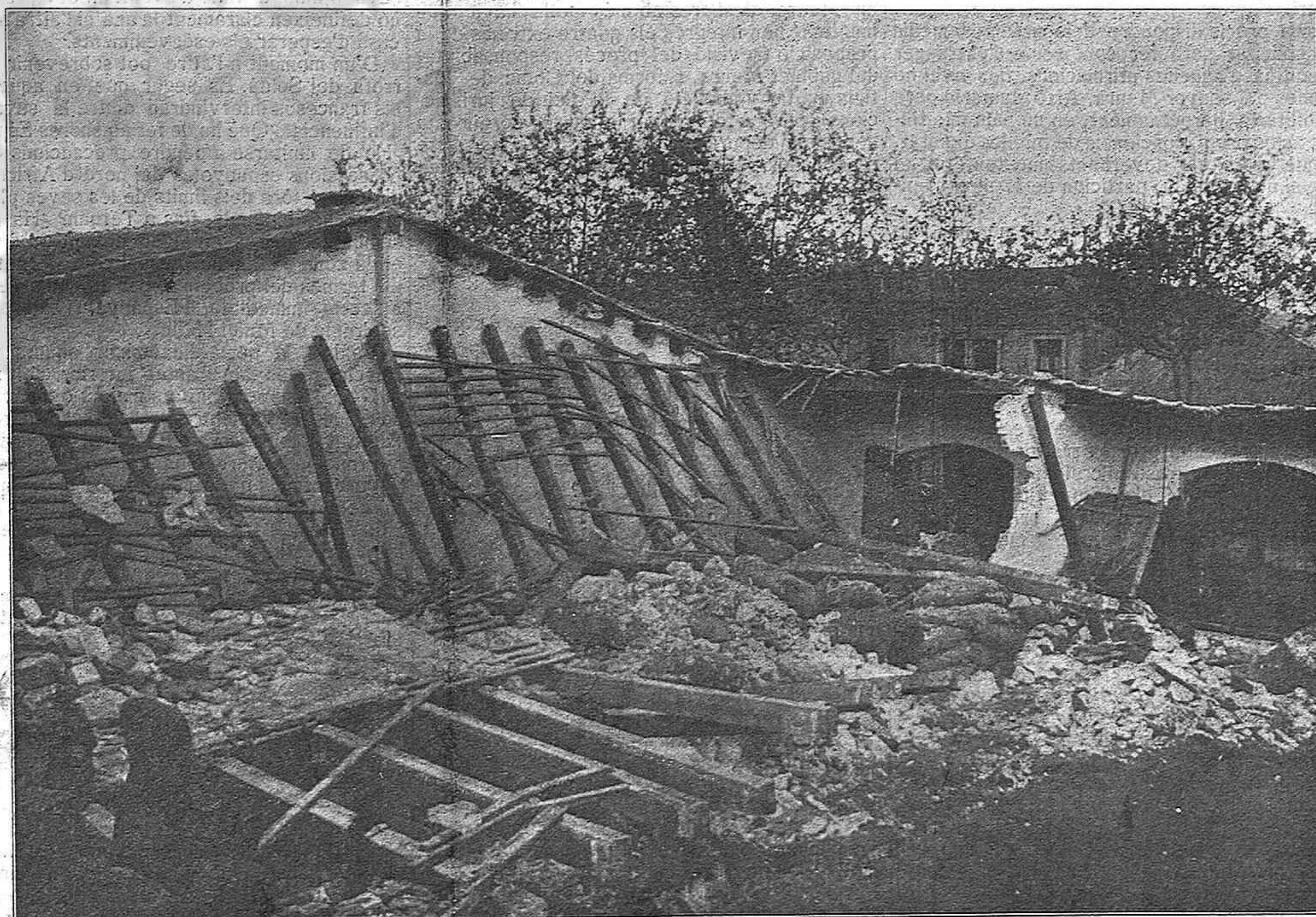
Catàstrofe ocorreguda el dimecres al carrer de Carrera, aont, al caure la paret d'un diposit de carbó, ocasionà l'enfonzament d'un magatzem de borra, quedant sota les runes dues dones mortes y quatre treballadors ferits.