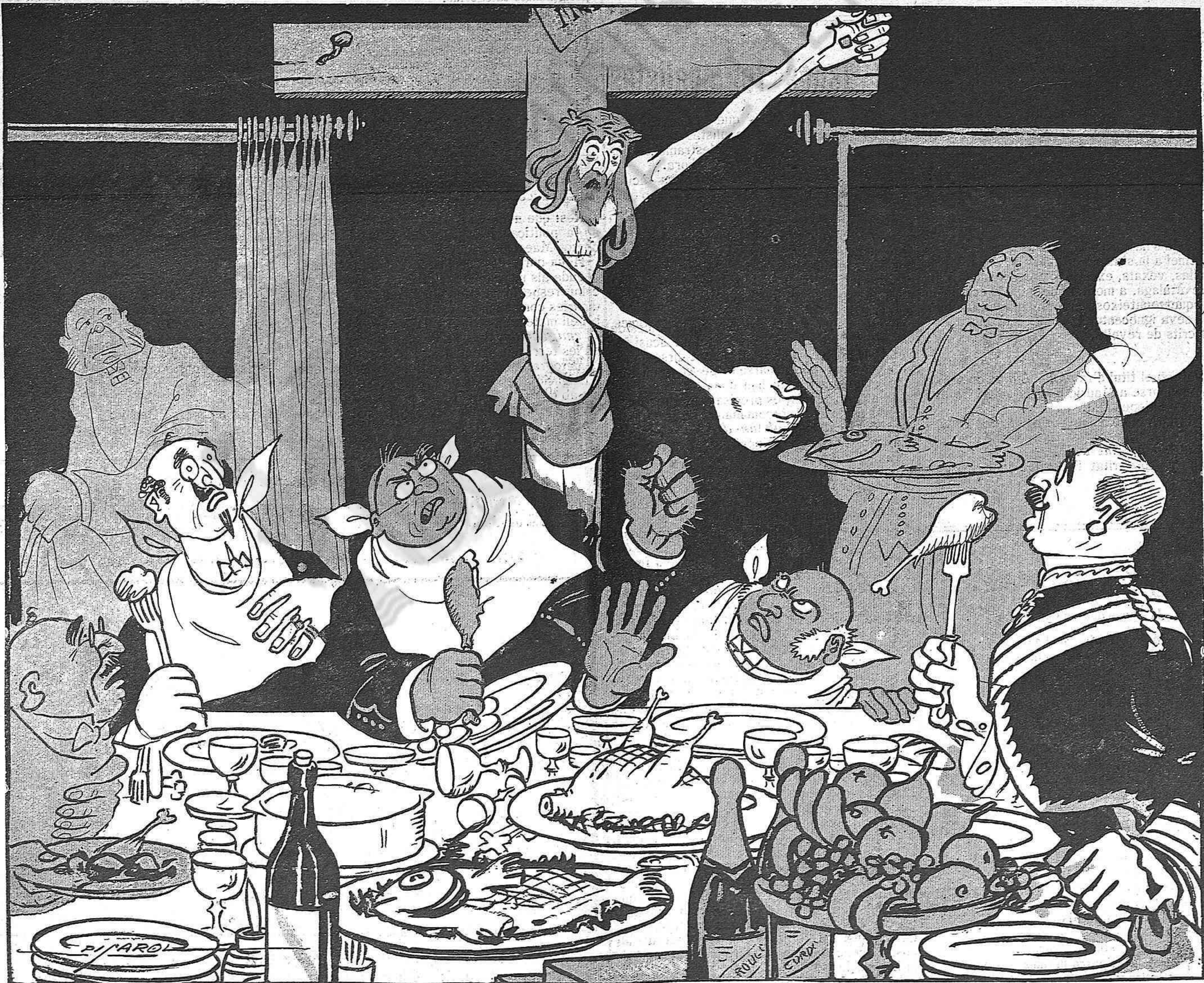
—El dia en que jo pugui desenganxarme de l'altra mà, ija veureu quin final té aquet tiberi!..