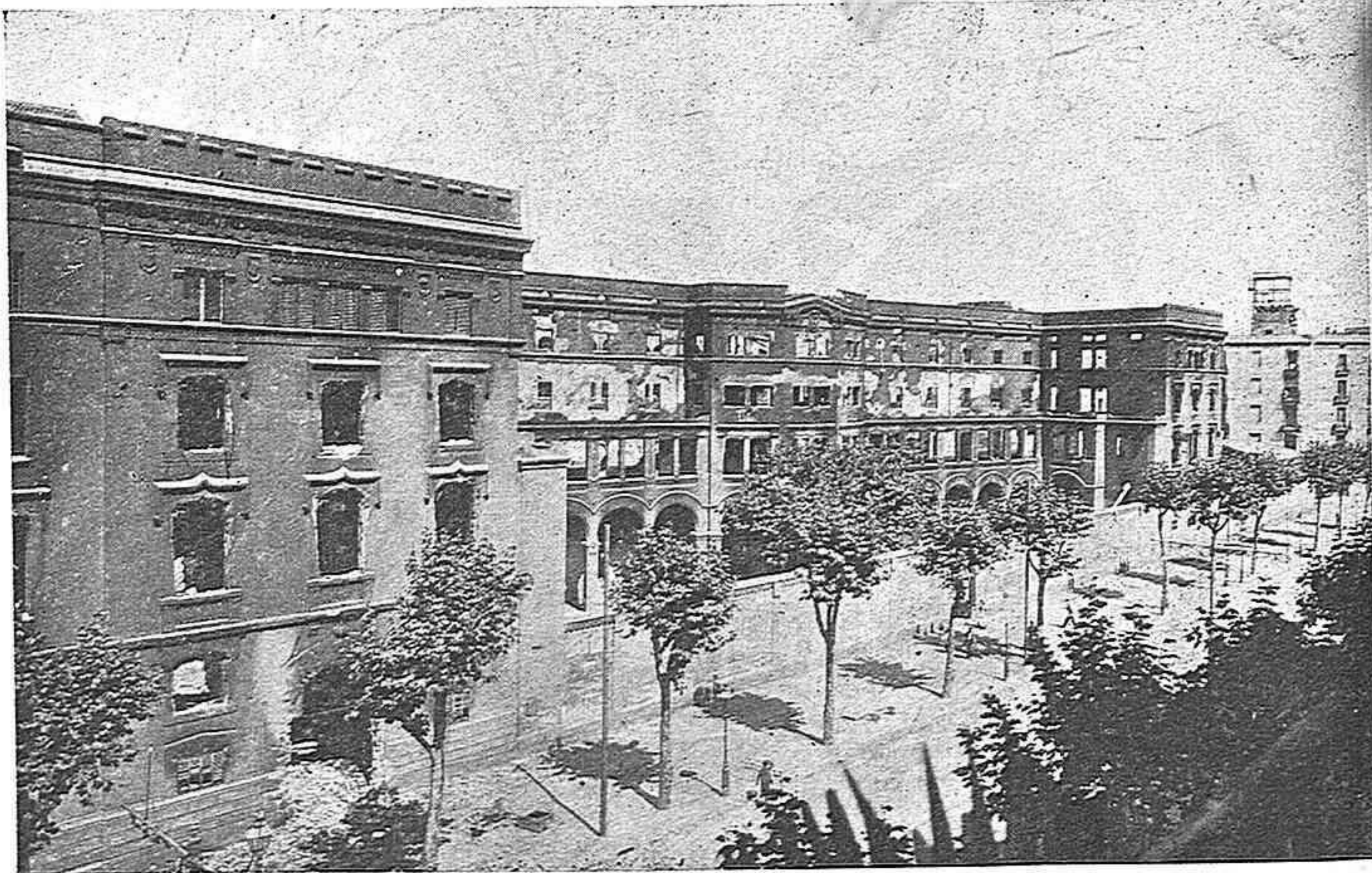
Aspecte del edifici dels Escolapios de Sant Antoni, després de la crema.