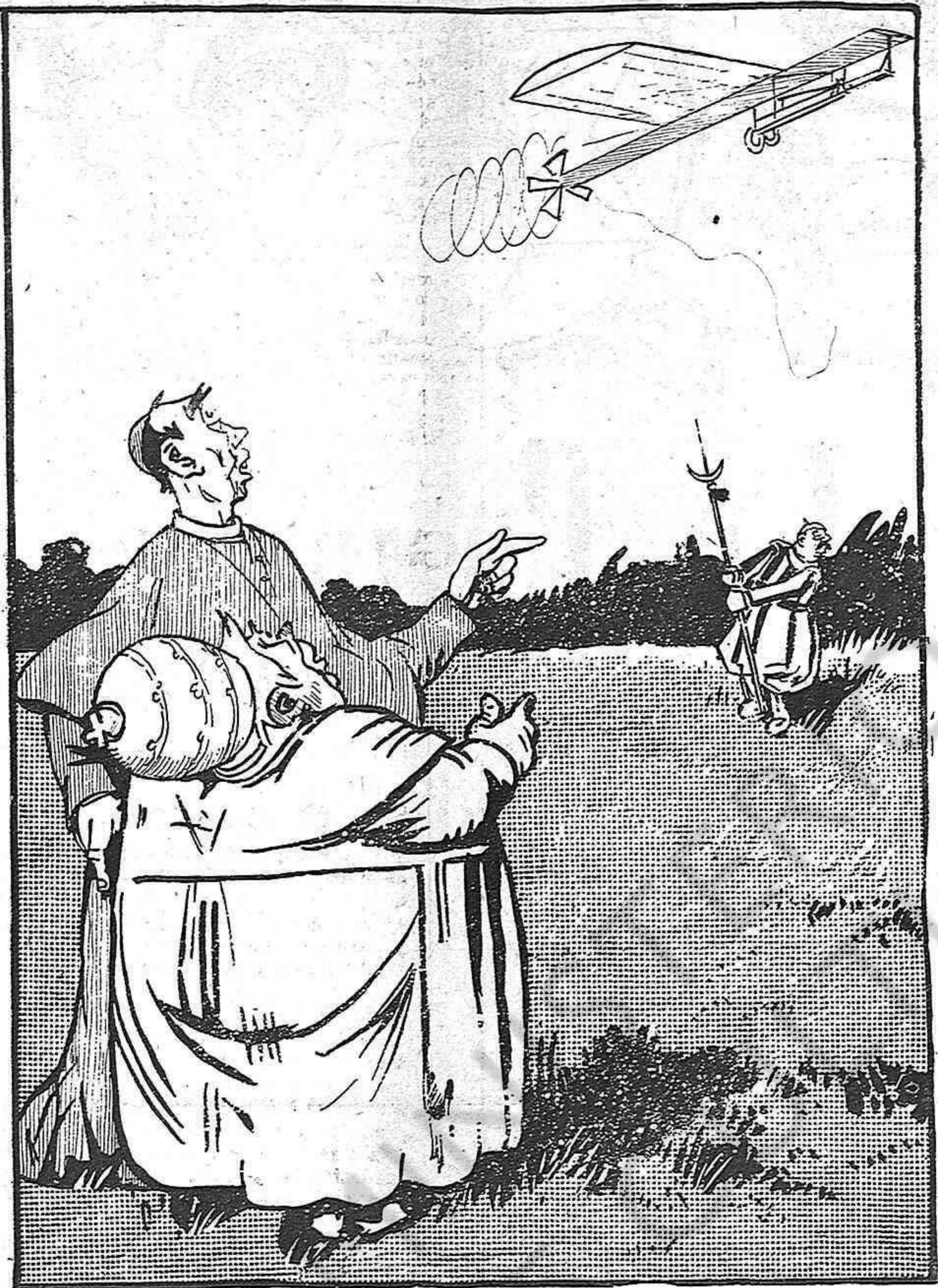
—Merry del Val, estem perduts!... Ab aquesta malehida invenció del aeroplá, la gent, per 'nar al cel, ja no 'ns necessitará per res á nosaltres.