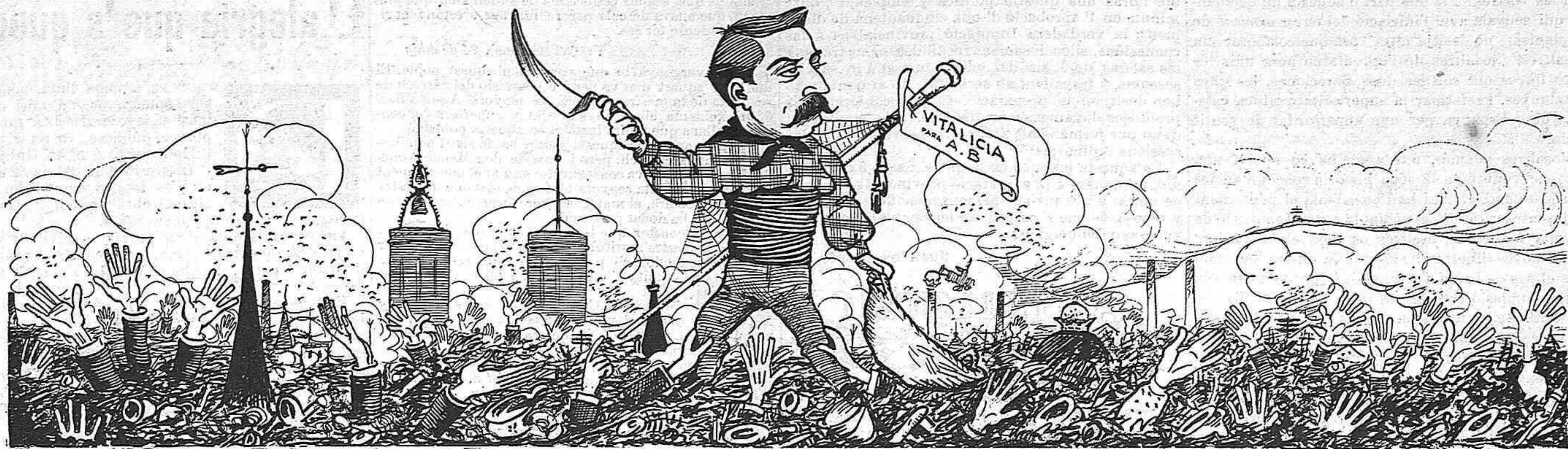
L' Arcalde, ocupant el lloch que li correspón.